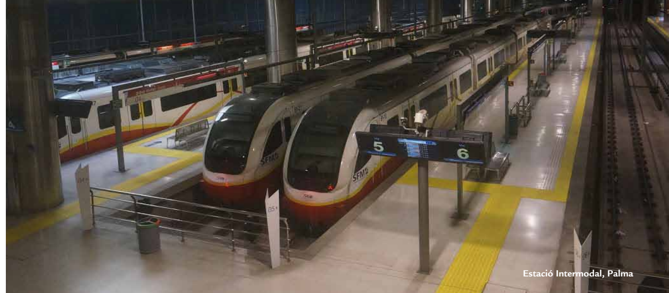
Estació Intermodal, Palma