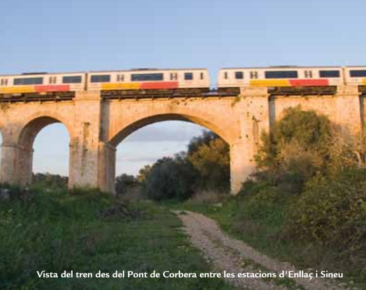
Vista del tren des del Pont de Corbera entre les estacions d'Enllaç i Sineu