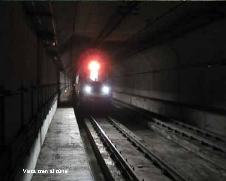
Vista tren al túnel