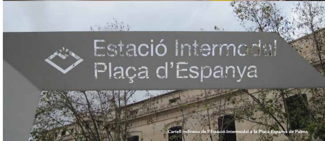
Cartell indicatiu de l'Estació Intermodal a la Plaça Espanya de Palma