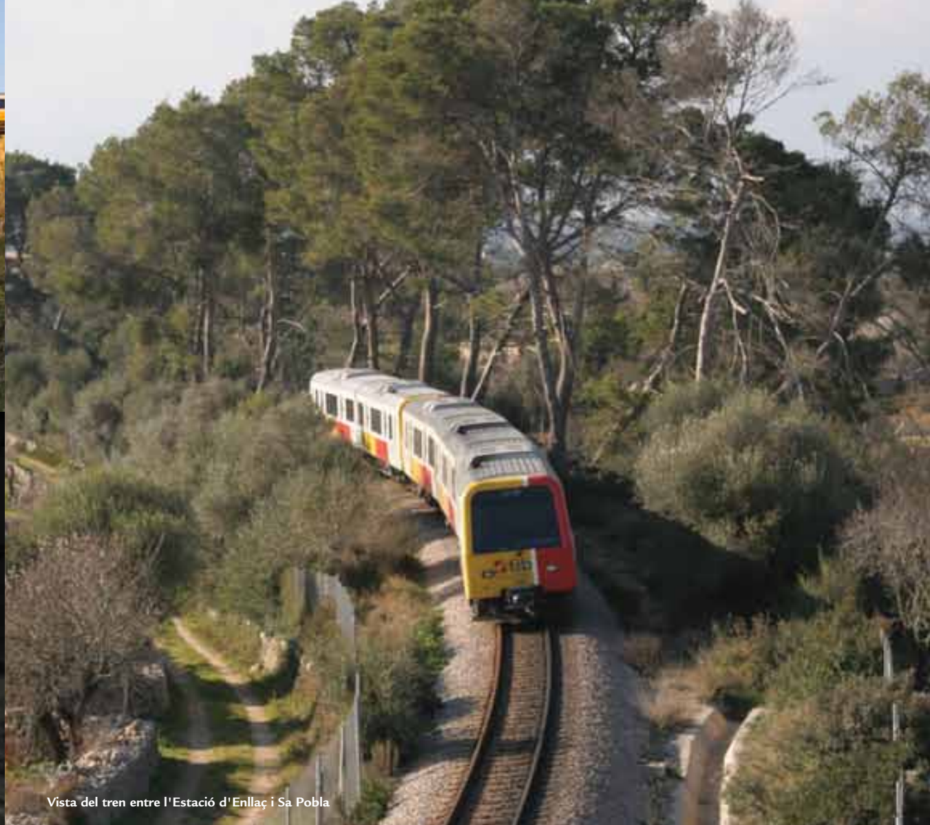
Vista del tren entre l'Estació d'Enllaç i Sa Pobla