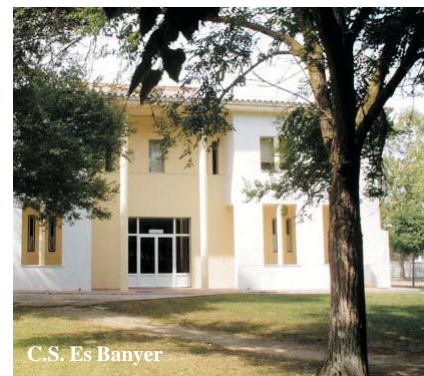
C.S. Es Banyer