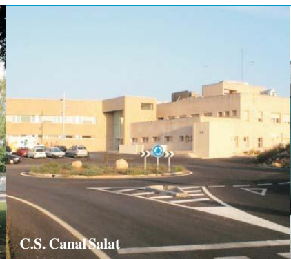
C.S. Canal Salat