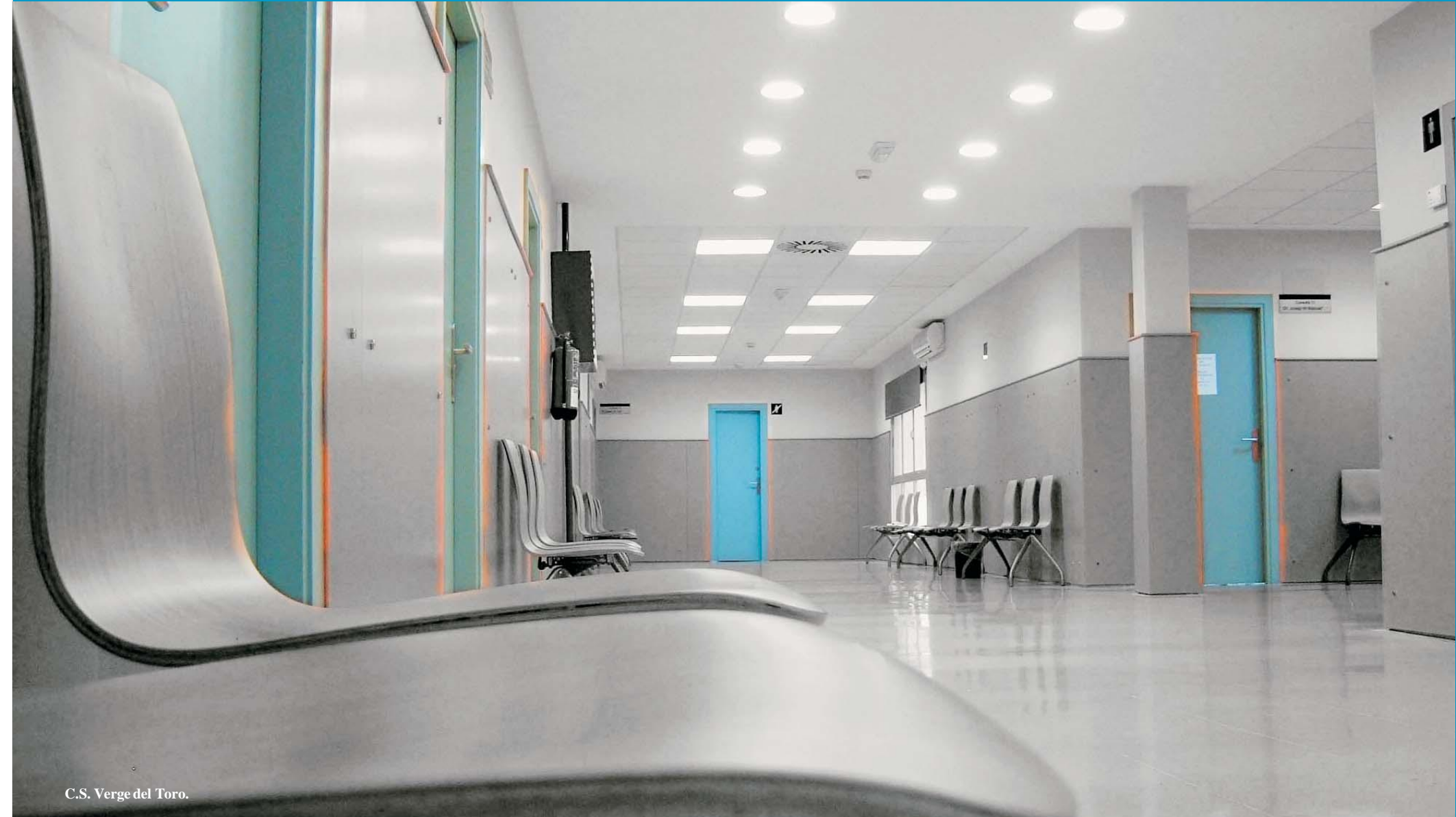
C.S. Verge del Toro.