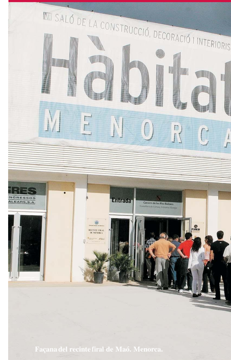
Façana del recinte firal de Maó. Menorca.