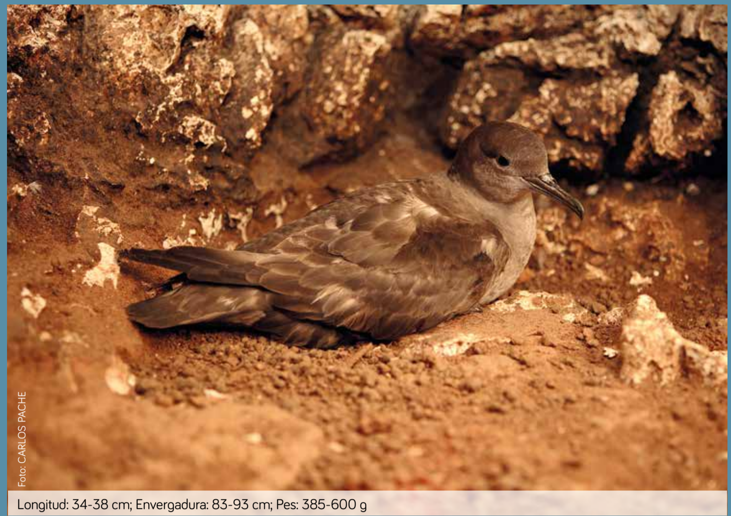
Longitud: 34-38 cm; Envergadura: 83-93 cm; Pes: 385-600 g