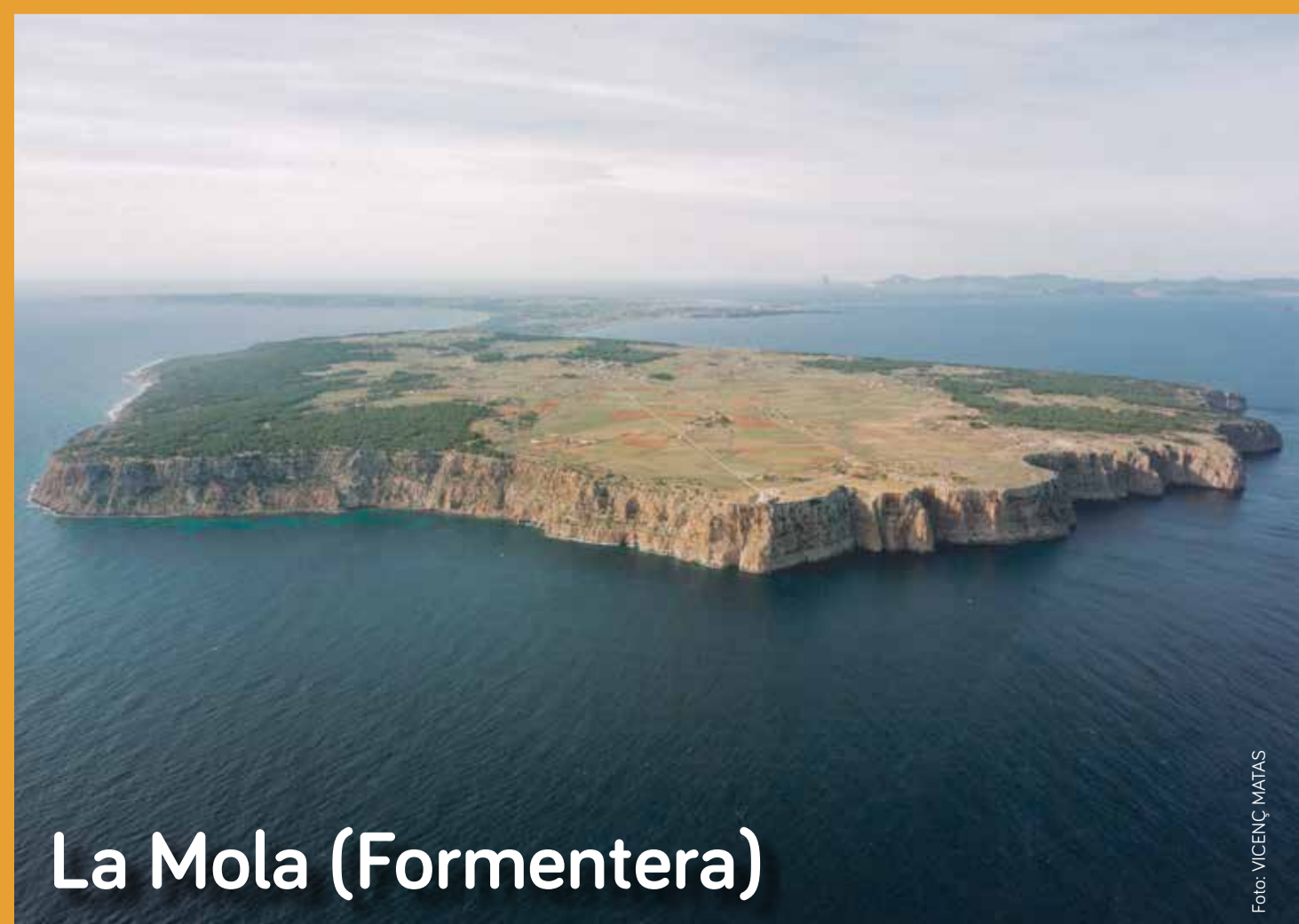
La Mola (Formentera)

Moltes colònies estan protegides en els parcs i reserves naturals, o a les ZEPAS (Natura 2000).