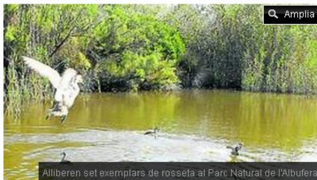
Alliberen set exemplars de rosseta al Parc Natural de l'Albufera

Jerez, on es fa un programa de cria de fauna ibèrica en captivitat. Els darrers quatre anys, s'han amollat una cinquantena de rossetes a l'Albufera.