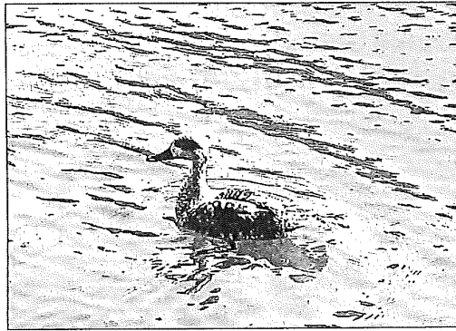
El plumaje de la cerceta es poco vistoso, de color terroso.