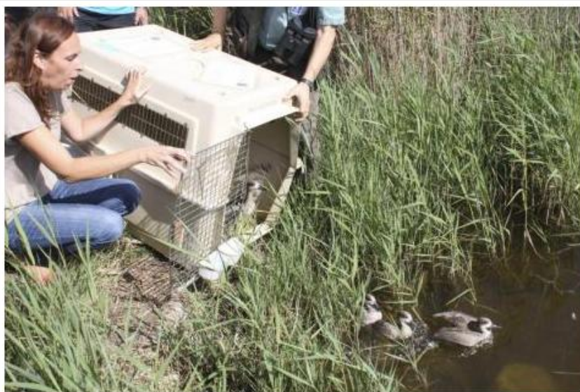
Las cercetas proceden del zoo de Jerez.

La cerceta pardilla es un pato de tamaño mediano con un plumaje poco vistoso, de color terroso y con manchas más claras. Pesa unos 500 gramos.