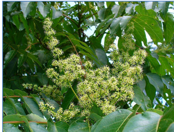
Detall flors mascles agrupades