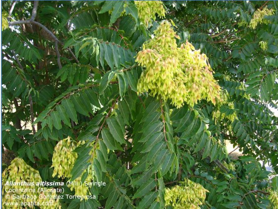
Arbre fructificat. Les llavors estan agrupades

Hàbitat : Ambients antropitzats: marges de carreteres, camps de conreu i torrents