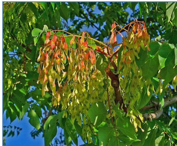
Detall fruits agrupats