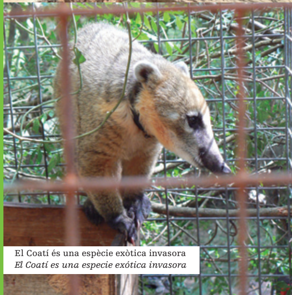
El Coati és una espècie exòtica invasora El Coati es una especie exótica invasora