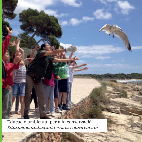
Educació ambiental per a la conservació Educación ambiental para la conservación