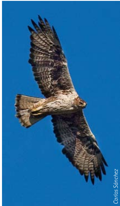
Adult en vol. Es pot observar la banda terminal de la coa, que li dóna nom.

És una espècie caracteritzada per tenir una edat de reproducció tardana (comença als 3-4 anys), una baixa fecunditat i una supervivència adulta elevada.