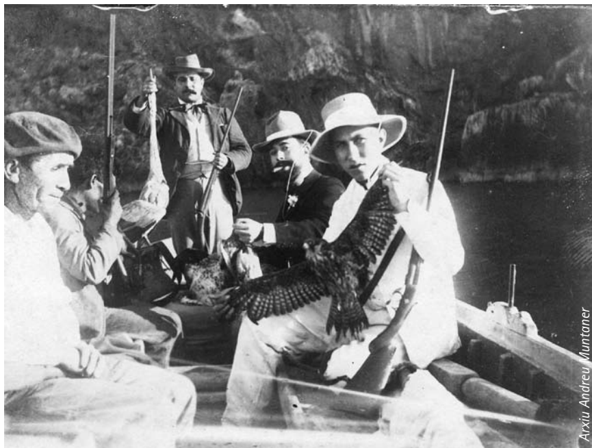
Arxiu Andreu Muntaner

Una caçada a la serra de Tramuntana a principis del segle XX. El 1966 tots els rapinyaires quedaren oficialment protegits a Espanya.