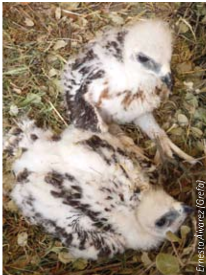
Ernesto Álvarez (Grefa)

Realitzar alliberaments experimentals durant quatre anys, al final dels quals se valorarà, per part del comitè de tècnics, la viabilitat a llarg termini de la població mallorquina.