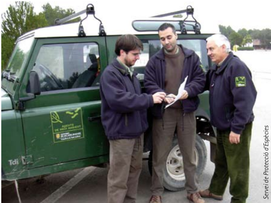
Servei de Protecció d'Espècies

Per dur endavant un pla de reintroducció de qualsevol animal o planta, hi ha uns preceptes a tenir en compte: són els criteris de la Unió Internacional per a la Conservació de la Naturalesa (UICN) per a reintroduccions. Diuen que primer han d'haver desaparegut les causes que van extingir l'espècie i que les condicions de la natura han d'esser adients per allotjar-la.