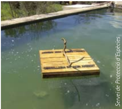
Servei de Protecció d'Espècies

Molèsties prop del niu: L'increment de l'excursionisme i altres activitats d'oci a la natura poden causar l'abandonament del niu. Hi ha camins tancats per evitar aquests problemes i s'informa de rutes alternatives.