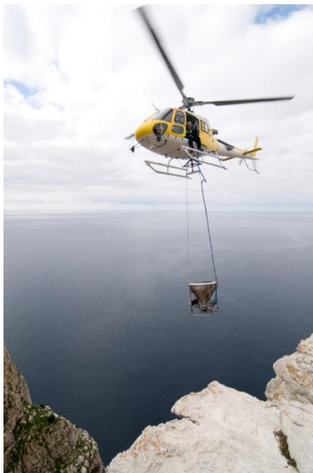
Foto: Sa Dragonera va ser desratitzada el 2013, amb les tècniques més modernes disponibles, i ha estat un dels projectes més emblemàtics del servei en els darrers anys. La resposta de la població de virot petit a l'illa va ser immediata, amb èxit reproductor a nius que eren inviables per la presència de rosegadors.