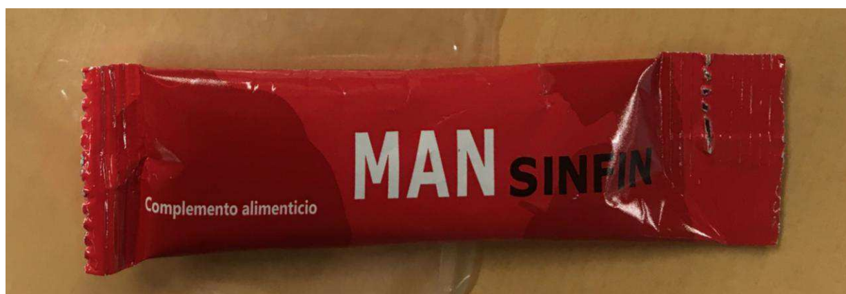
Fig.1: Imagen del producto MAN SINFIN SOBRES .

La prohibición de la comercialización y la retirada del mercado de todos los ejemplares del citado producto.