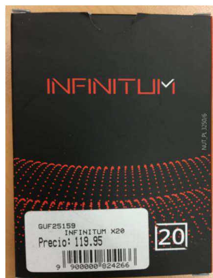
Fig.4: Imagen del producto INFINITUM COMPRIMIDOS.