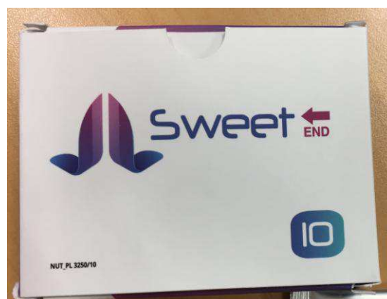
Fig.2: Imagen del producto SWEET END SOBRES.

Agencia Española de Medicamentos y Productos Sanitarios