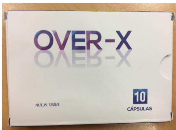
Fig.3: Imagen del producto OVER-X CÁPSULAS.