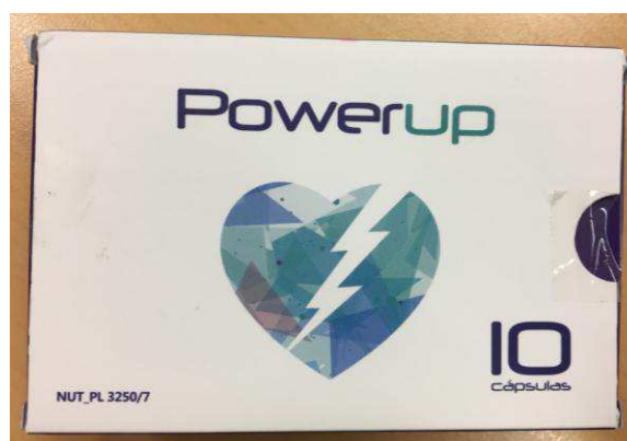
Fig.5: Imagen del producto POWERUP CÁPSULAS.