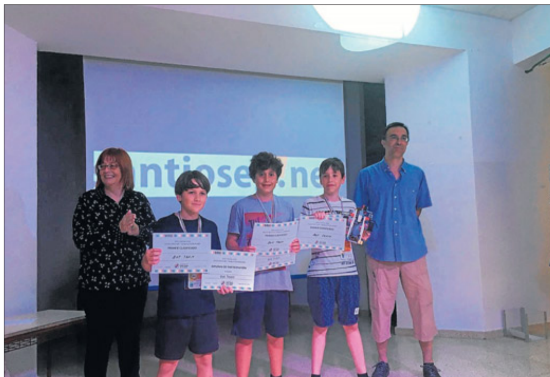
Los ganadores del torneo de robótica, con sus premios. ASJ

Según el Ayuntamiento, tras 15 años de historia, la Orquesta «necesita un replanteamiento y se considera prioritario que la dirección pase a manos de una sola persona que pueda trabajar de manera coordinada con los músicos y el profesorado de la escuela de música, para poder ir incorporando a la orquesta a los alumnos y dar continuidad al proyecto».