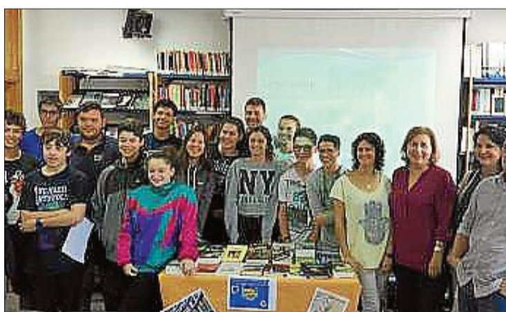
Grupo de estudiantes del programa Erasmus+. SA COLOMINA

El 25 de noviembre a las 20.30 horas se representará la obra de teatro 'Spanish Cirkus', dirigida e interpretada por Laurita Varela y recomendada para mayores de doce años. Un marido que está en el más allá, un ama de casa que lucha por salir de una crisis paranormal, una abuela canalla... Un circo de familia.