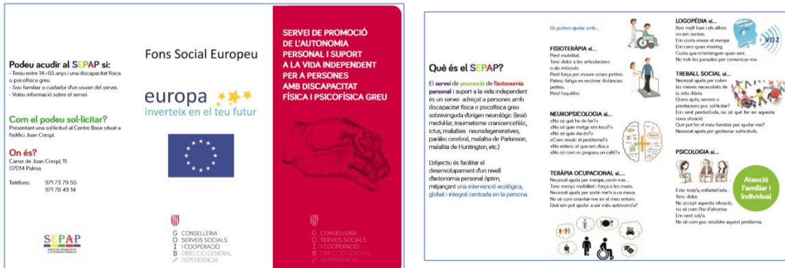
Il·lustració 7: Cartel·l informatiu