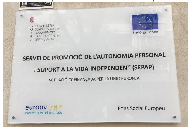
Ilustración 5: Placa permanente en la sede donde se presta el servicio