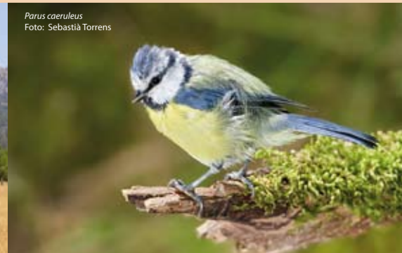
Parus caeruleus