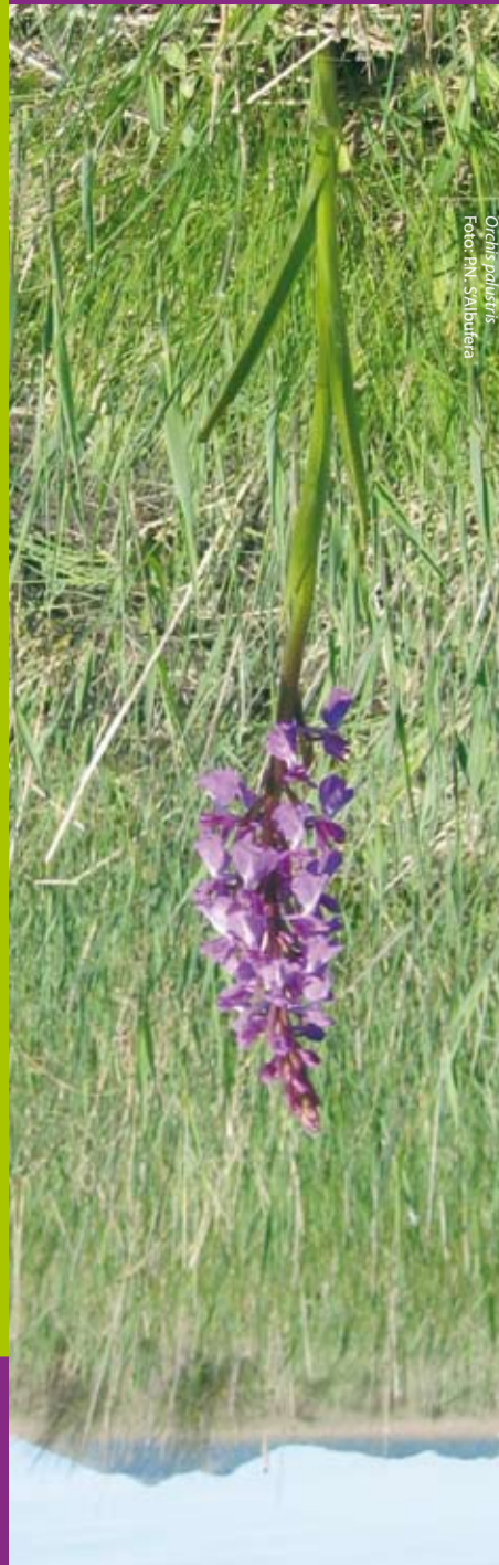
Orchis poduaria