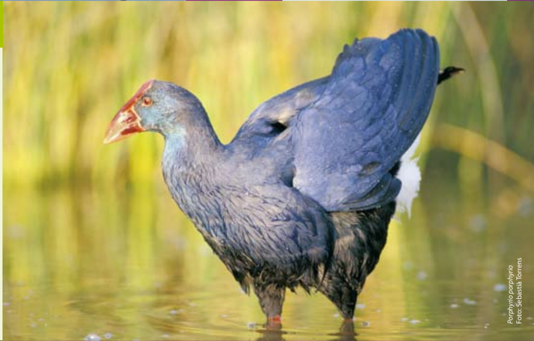
Porphyrio porphyrio

S'Albufera és la zona humida més extensa i important de les Illes Balears (1.646,48 ha), sobretot de prat, inclosa dins els termes municipals de Muro i sa Pobla. Té un origen molt antic i ha variat en extensió i característiques segons els canvis en el nivell de la mar. Part del prat s'originà a l'era terciària, però l'actual zona humida es va formar fa menys de 100.000 anys. Les dunes litorals són més modernes, d'uns 10.000 anys d'edat.