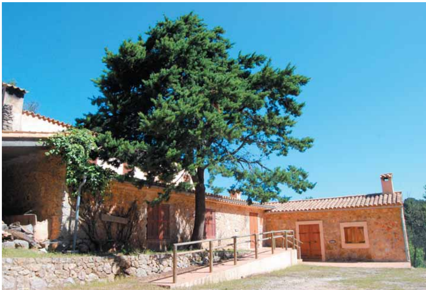
Cases de sa Coma d'en Vidal

Un parell de revolts més amunt, passam pel costat de les restes d'un forn de calç, on els calciners treballaven durament per convertir la pedra calcària en calç viva. Continuem pujant i després d'un parell de voltes més uns xiprers ens indiquen que aviat arribarem a les cases de la finca de sa Coma d'en Vidal, que és de titularitat pública des de l'any 2002. Davant les cases, hi ha una petita edificació amb un porxet que ens convida a aturar-nos a berenar.