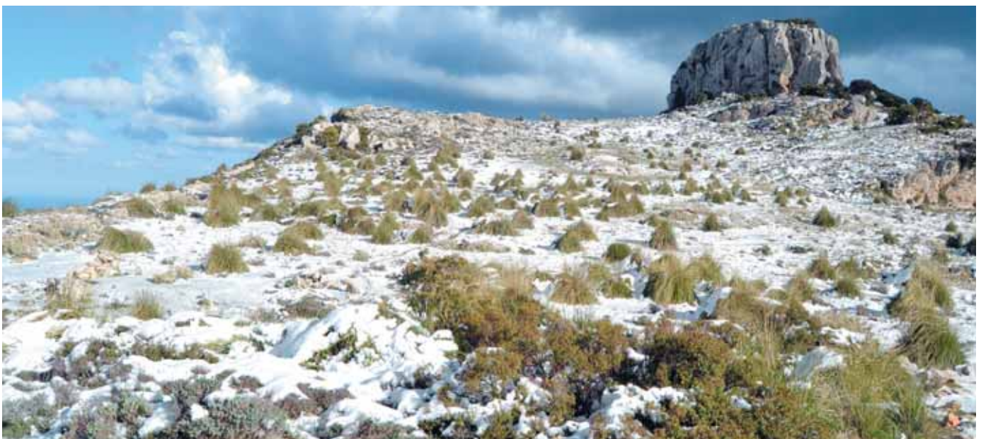
Vista de la penya Blanca