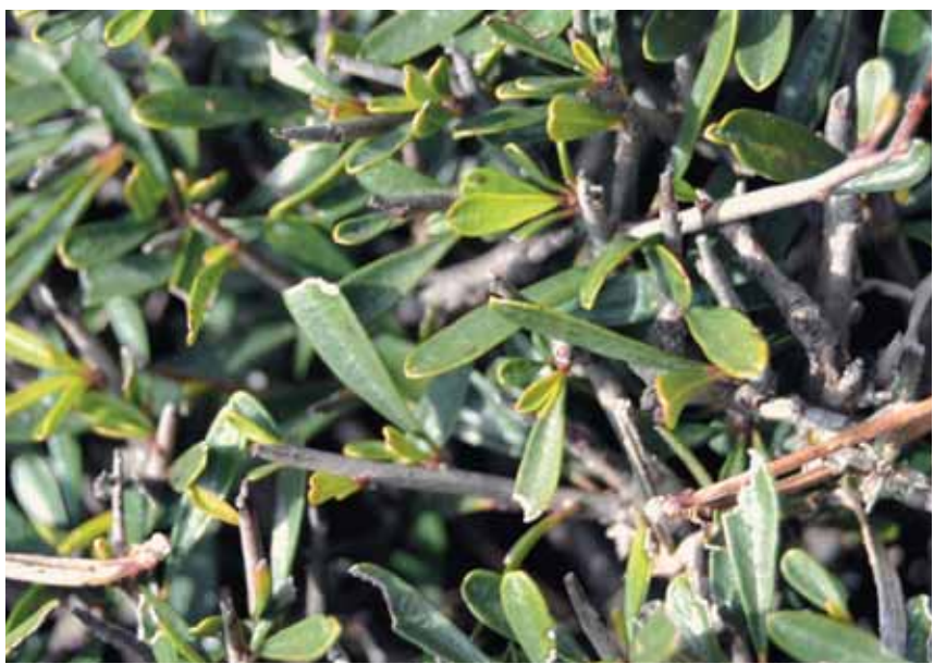
Mal hivern

Seguim amb esment les fites de pedra, per un tram sense un tirany definit, fins a arribar al camí de pujada al puig de Galatzó. Giram cap a l'esquerra i sempre de baixada arribam a l'àrea recreativa de Son Fortuny, on podem fer un merescut descans.