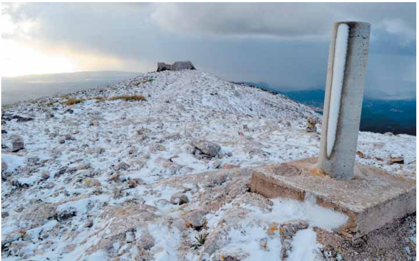
Vèrtex geodèsic dalt del cim i les runes de la caseta de n'Aragó al fons

Pujar fins aquí té doble premi. Una vista magnífica de 360° sense obstacles intermedis, i a uns 100 metres cap a l'esquerra, unes solitàries runes plenes d'història... i d'històries. Són les restes del petit observatori on visqué l'any 1808 l'astrònom, polític i matemàtic rossellonès Dominique François Aragó. En aquest ambient tan hostil, Aragó hi passà dures jornades per mesurar l'arc de meridià terrestre entre Catalunya i les Balears. Aragó triangulava entre Mallorca, Eivissa i Formentera per acabar d'estendre el meridià de París fins a les Illes.