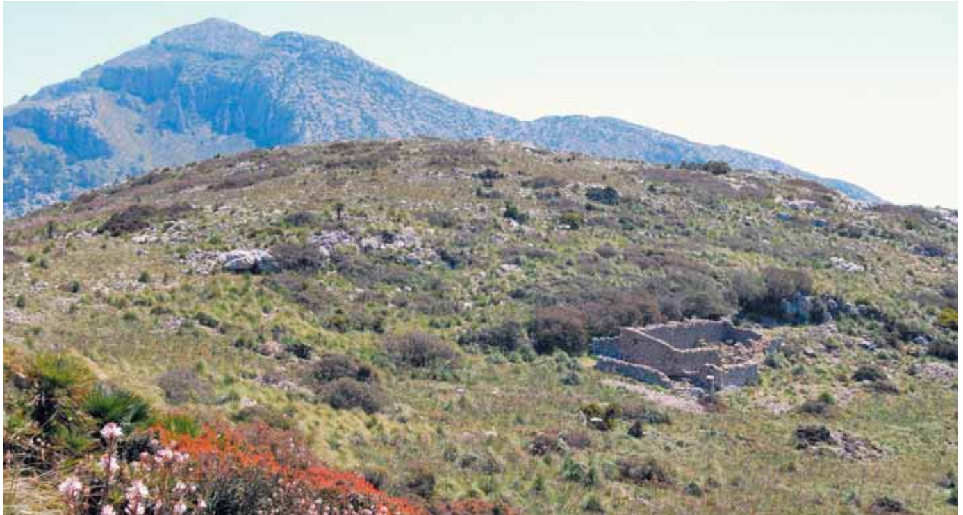
Runes de les cases de s'Esclop amb el Galatzó al fons (Gràcia Salas)

A vegades es pot veure com sobrevola aquesta zona algun exemplar d'esparver o àguila calçada ( Hieraaetus pennatus ), un rapinyaire de mida mitjana que nidifica pels penyals de la Serra. S'alimenta d'una gran diversitat de preses: tudons i coloms; petits aucells com gorrions, estornells, oronelles..., i també petits mamífers com ratolins o conills. Més sovint veurem el cabot de roca ( Ptyonoprogne rupestris ) volant prop dels espadats on troba aliment i nidifica.