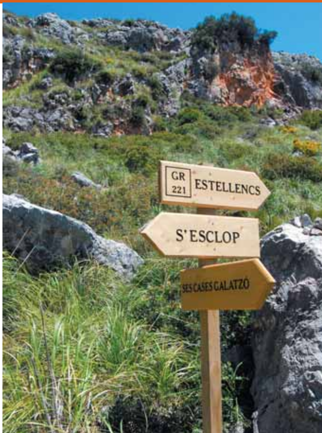
Cruïlla de camins

Baixam del cim per la mateixa ruta de pujada, en direcció a la penya Blanca. Tornam a passar el coll i l'era de batre fins a arribar, per la zona de pinar, a la paret seca, que fa partió amb el terme d'Estellencs. Cap a l'esquerra tornariem per sa Coma d'en Vidal, però no botam la paret sinó que ens desviam cap a la dreta.