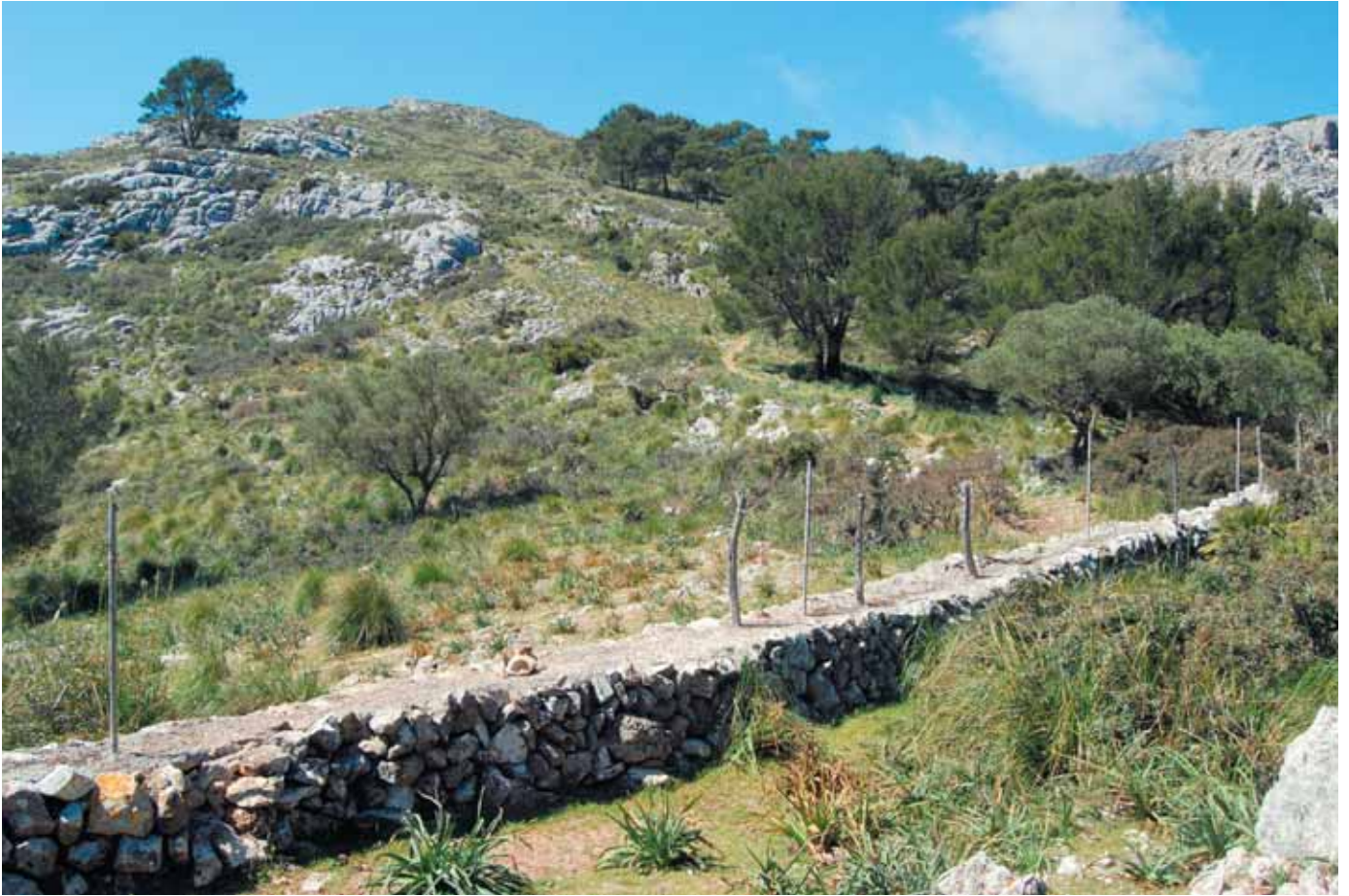
Paret seca que fa de límit del terme d'Estellencs. A la dreta es veu el tirany per pujar a s'Esclop

Passam pel botador que ens queda a l'esquerra i, sense deixar el camí, que està ben atapeït de càrritx, arribam a una paret seca que marca els límits del terme d'Estellencs i de la finca de sa Coma. Botam la paret, entram a la finca pública de Galatzó i continuam la pujada per un tiranyet que es veu a la dreta ben definit entre pins fins a arribar a una antiga era de batre. Un poc més endavant es veuen les runes de les cases de s'Esclop, abans emprades com un centre agrícola de muntanya, quan es cultivaven, amb gran esforç, aquestes terres.