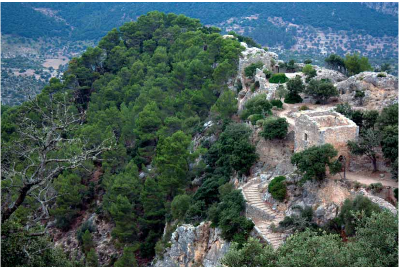
Vista del Castell

El camí de retorn cap a Alaró s'ha de tornar a fer cap a la torre de l'Homenatge, desfent el camí d'ascens. De tornada, les vistes canvien i ens trobam amb l'escenari dels camps d'oliveres just als nostres peus i amb el Pla al fons.