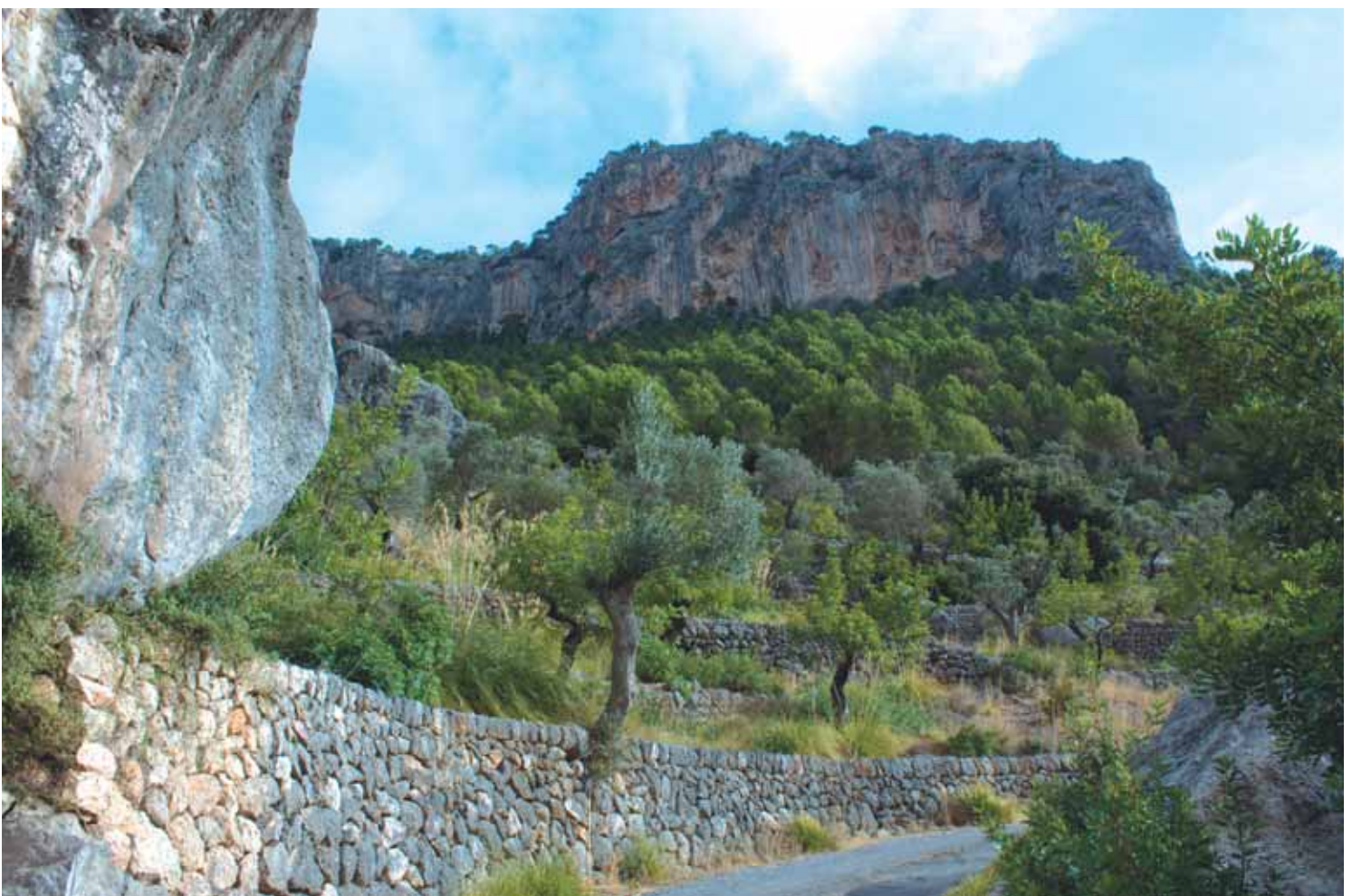
Camí cap al Castell

Primer la pista està asfaltada, però hem d'estar atents perquè la pista actual es creua en diferents punts amb l'antic camí empedrat que pujava fins al Castell. Tot d'una superada la primera costa, que transcorre entre altes parets de les primeres finques veïnes al camí, tindrem a la vista el puig d'Alaró. Des d'aquí ja ens feim una idea de com era d'inexpugnable. L'envolten camps planers de conreu dedicats a l'ametlerar. Aviat, però, el pendent del camí es comença a fer més pronunciat i les alzines l'ombregen i li donen un aire misteriós. Des d'aquest punt podem veure com el vessant és ja una paret vertical nua de vegetació. No us preocupeu, arribarem al cim seguint el sinuós camí empedrat que creua l'alzinar i s'arrapa a la paret fins a trobar l'únic pas cap al Castell.