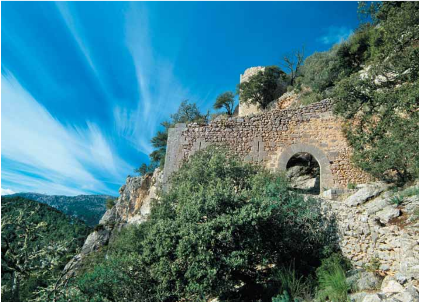
Porta d'entrada al Castell

La porta d'entrada és l'únic accés al Castell a peu pla i és el primer element defensiu que es trobaven els assetjadors. Està constituït per una avantmurada amb portal medieval d'arc rodó. A banda i banda del portal, podem veure unes obertures estretes i allargassades que reben el nom d'espitlleres. N'hi ha tres en total, i tenen l'amplada justa perquè els defensors poguessin mirar a l'exterior i disparar sense perill de ser ferits des de fora.