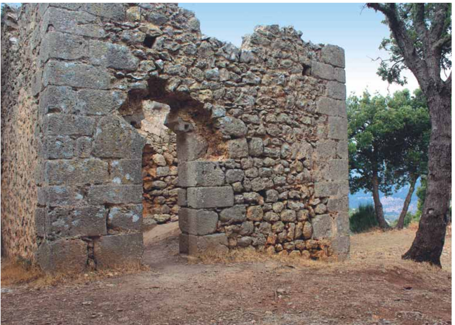
Torre de Migjorn

A la dreta ens trobam una esplanada on encara són visibles les restes d'un gran aljub, amb una bassa petita a la vora. Seguint el perímetre de l'aljub, resta un parament de murada amb merlets.