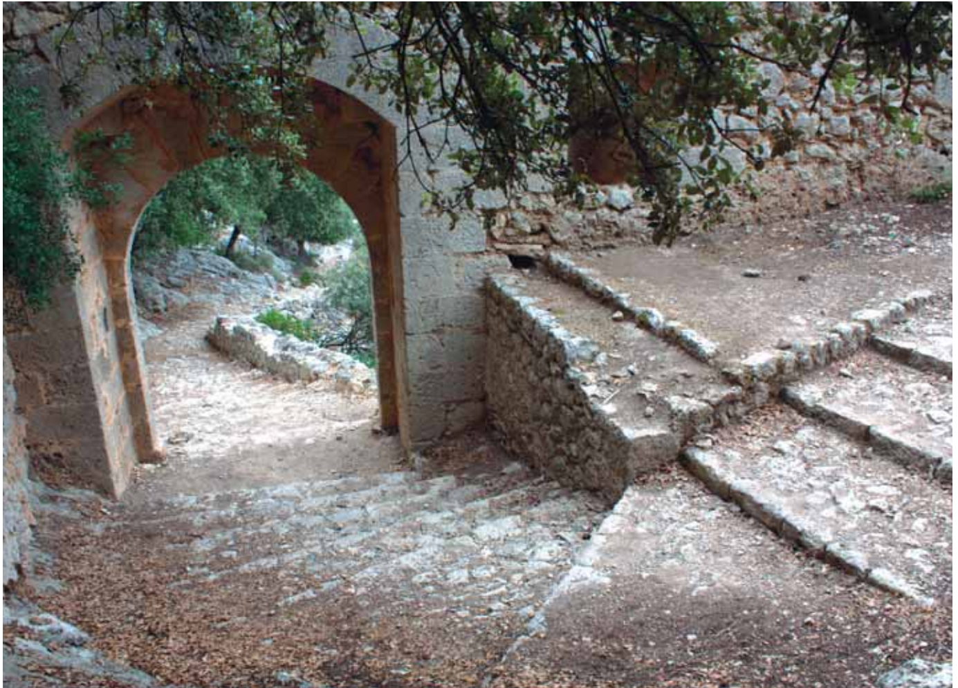
Entrada al interior del Castell

porta: la torre de l'Homenatge. La gent la coneix com el constipador , perquè en aquest punt hi corre l'aire i després de la pujada s'hi arriba suat. El costat esquerre de la torre es va construir aprofitant la penya natural. Sobre el portal d'ingrés, hi ha una espècie de balcó, anomenat matakà, que s'utilitzava per vigilar i llançar pedres i materials ardents als atacants quan aquests intentaven tombar la porta.