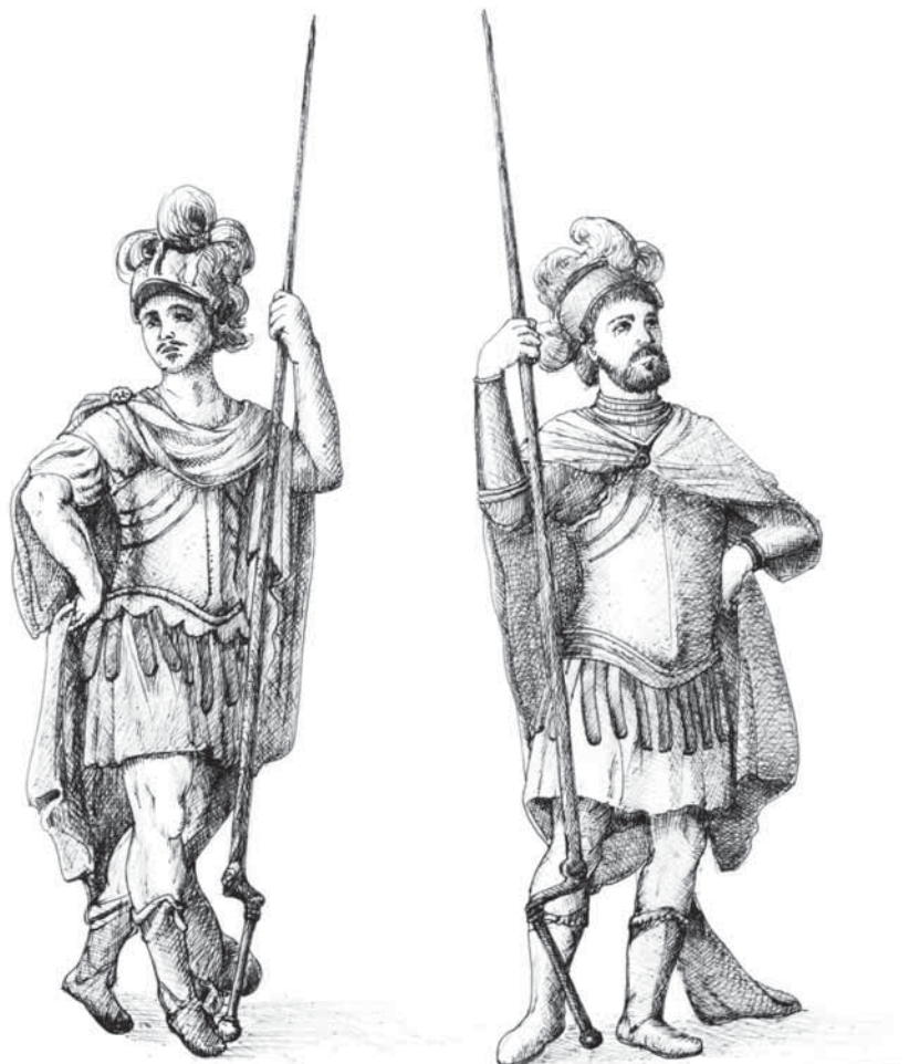
En Cabrit i en Bassa (Dibuix: Vicenç Sastre)

Una vegada que el Castell fou conquerit, la llegenda afirma que Alfons va complir la seva amenaça i Cabrit i Bassa foren torrats de viu en viu.