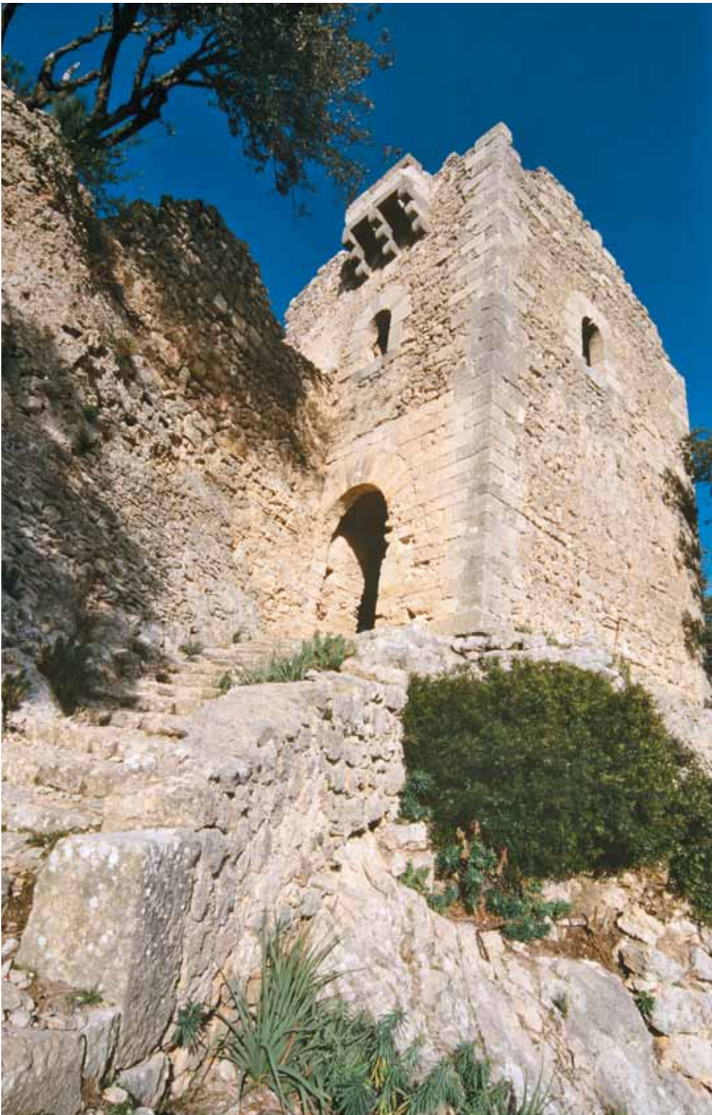
Torre de l'Homenatge