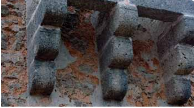
Matacà a la torre de l'Homenatge

que hi tingué lloc. A la petició de rendició contestà Guillem Cabrit en nom dels defensors, irat i sarcàstic: