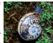
Caragol de serp - Iberellus balearicus (Gràcia Salas)