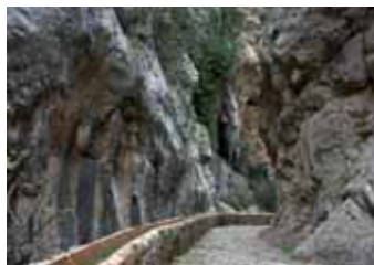
Canaleta vora el camí empedrat (Esperança Perello)

Els albellons són galeries subterrànies que es construïen als llocs on l'aigua tenia tendència a embassar-se. Primer retiraven part de la terra i hi col·locaven una capa de pedres