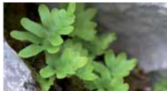
Polipodi - Polypodium cambricum (Esperança Pirelló) Dauradella - Ceterach officinarum (Esperança Pirelló)

Les enclotxes de les roques són colonitzades per plantes capaces de viure amb molt poqueta terra, com per exemple el polipodi i la dauradella, entre altres. Acostau-vos hi per conèixer-les.