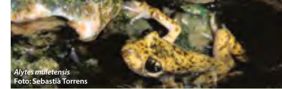
Alytes muletensis

Tampoc no és recomanable fer el recorregut des de sa Calobra si no coneixeu gaire bé el torrent, ja que en alguns punts és molt fàcil perdre's.