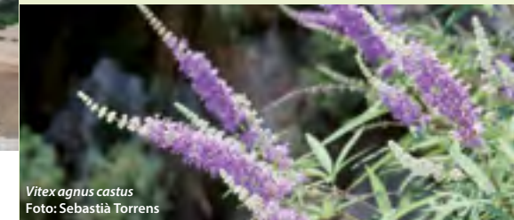
Vitex agnus castus

Entre les aus, hi destaca per la seva abundància el colom salvatge ( Columba livia ), la pàssera ( Monticola solitarius ) i el cabot de roca ( Ptyonoprogne rupestris ), i entre els mamífers, el mart ( Martes martes ), la geneta ( Genetta genetta ), el ratolí de rostoll ( Apodemus sylvaticus ), la cabra orada ( Capra hircus ) i diverses espècies de ratapinyades.