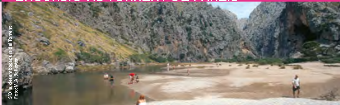
S'Olia, desembocadura del torrent

Posteriorment, tot l'àmbit territorial del Monument va quedar inclòs dins el Paratge Natural de la Serra de Tramuntana, per acord del Consell de Govern de 16 de març de 2007 (BOIB núm. 54 ext., d'11 de juny de 2007). El torrent és, a més, una àrea natural d'especial interès (ANEI) per la Llei 1/1991, de 30 de gener, d'espais naturals i règim urbanístic de les àrees d'especial protecció de les Illes Balears, i està inclòs en la Xarxa Natura 2000 com a lloc d'importància comunitària (LIC) i zona d'especial protecció per a les aus (ZEPA).