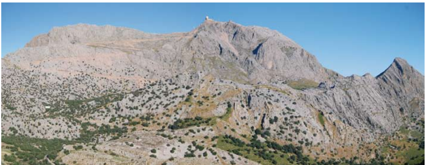
Vista del puig des Migdia, el Puig Major i el puig de ses Vinyes des de la canaleta dels embassaments

Si és primavera, el color groc intens i lluminós de les argelagues ( Calicotome spinosa ) ens acompanyarà en aquest camí de tornada. Una repoblació feta fa uns trenta anys amb pinassa ( Pinus nigra ) és el senyal que som a prop del nostre punt de partida. Abans d'arribar