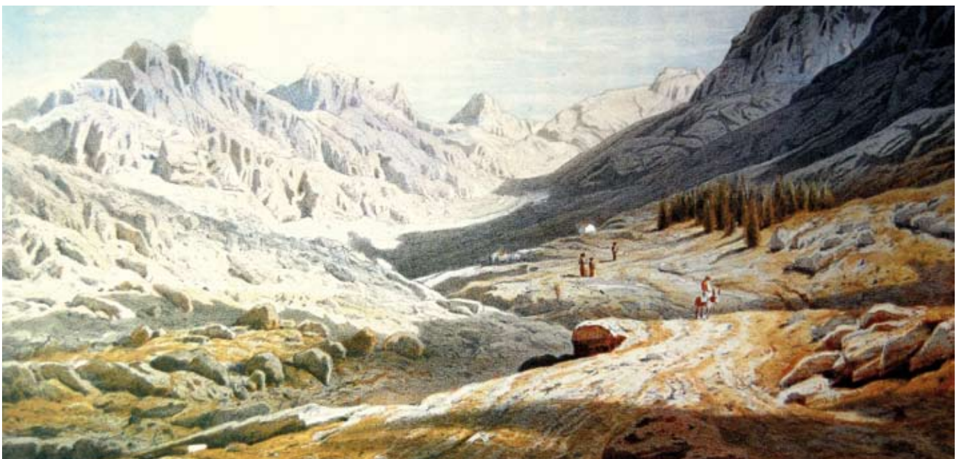
La vall de Cúber vista des de les proximitats del coll de l'Ofre en un gravat del Die Balearen , de l'arxiduc Lluís Salvador.

Després de la conquesta de Mallorca pel rei Jaume I, el terme de les Muntanyes va ser la part de l'illa que es va reservar el Rei, i es va repartir entre els participants de la conquesta. En el Llibre del repartiment , hi apareix amb una extensió de quinze jovades (una jovada era una mesura superficial agrària que equival a una extensió de terra que una parella de bous pot llaurar en un dia, aproximadament a 11,36 hectàrees).