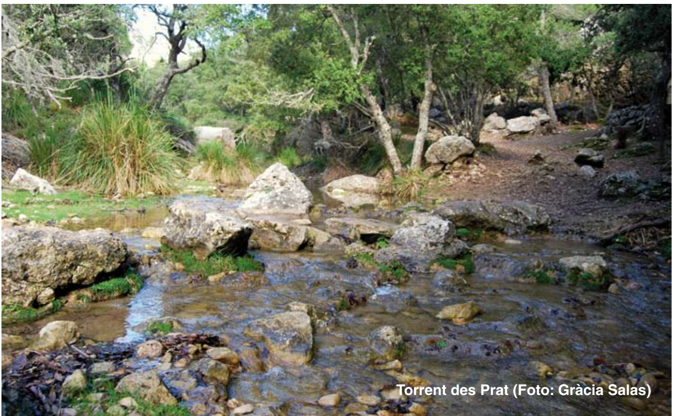
Torrent des Prat

Al cap de poc temps, tornam a travessar el torrentó per un pontet de fusta i pujam fins a arribar a un creuament de camins. Si volem, ens podem desviar momentàniament del nostre itinerari per arribar a la font des Prat de Massanella, de cabal permanent, amb mina i canalitzada mitjançant la canaleta de Massanella.