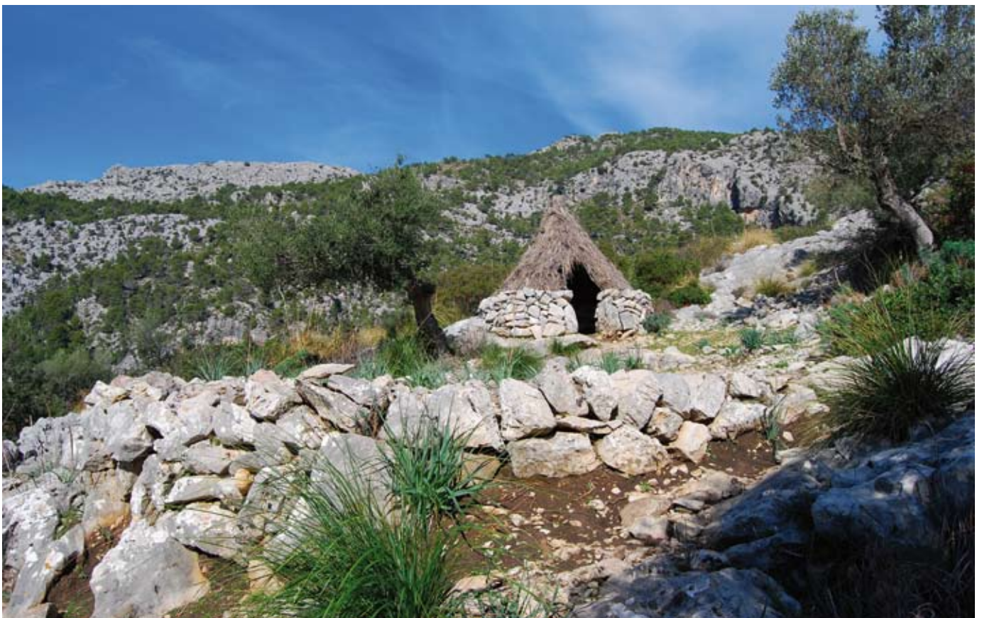
Rotlo de sitja i barraca de carboner

Bé passa la vida trista un fadrí que fa carbó. Jo vos puc dir, bona amor, que per fer coure un sitjó ha un mes que no us he vista.