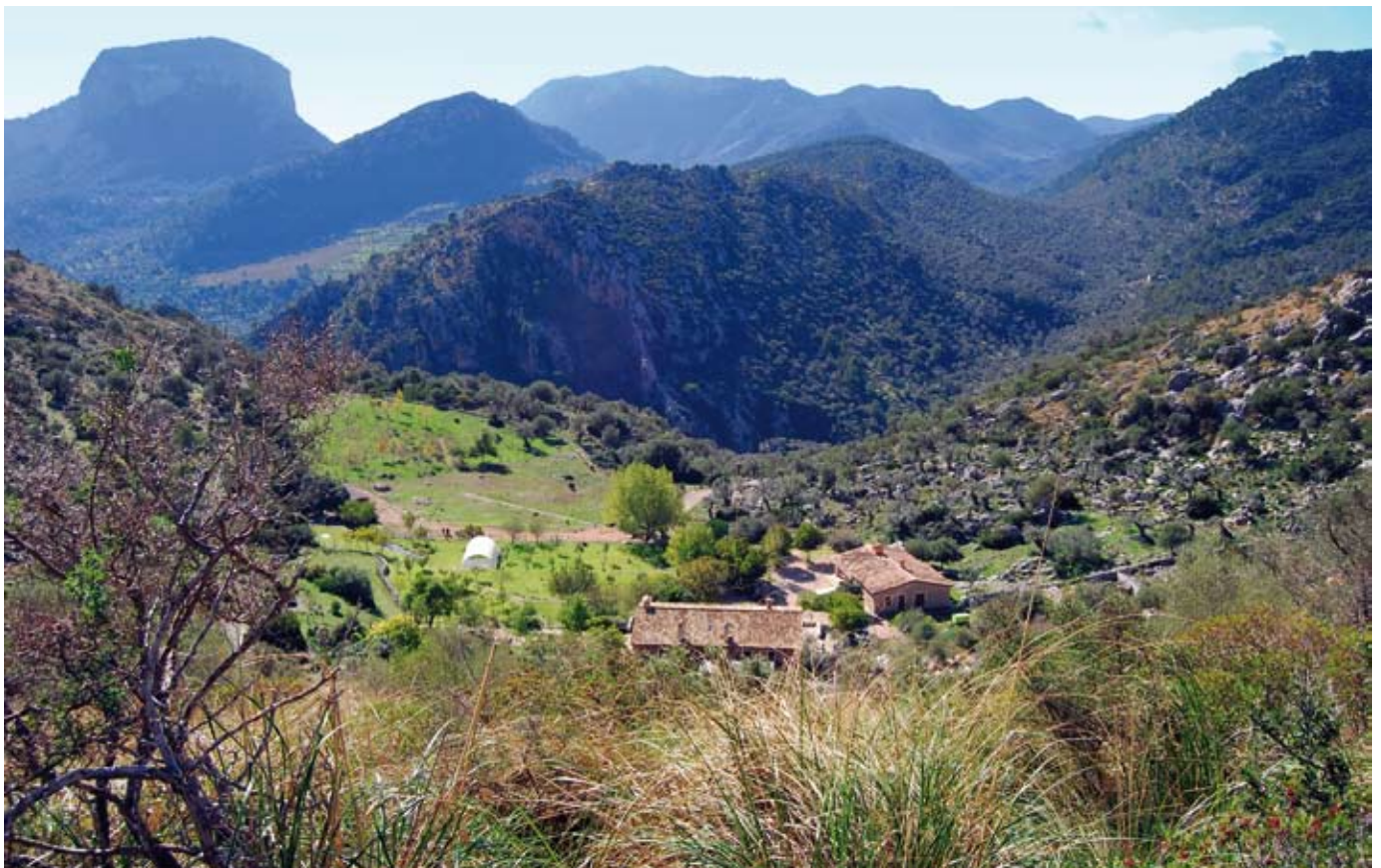
Refugi des Tossals Verds

Fent petites pujades i baixades per un terreny ara més rocós arribam a l'oliverar des Tossals Verds, una mostra de l'encertat equilibri entre la natura i els aprofitaments humans. En poc temps ens topam amb un camí transversal davant una paret de roca. Giram a la dreta pel costat d'una barana de fusta fins al refugi des Tossals Verds. Actualment, amb aquest topònim es designa la finca, el puig i les cases de possessió. La paraula tossal fa referència a una "elevació del terreny no gaire alta, ni de pendent gaire rost, en una plana o aïllada d'altres muntanyes". L'adjectiu verds el podem atribuir a la coloració que dóna un abundant carritxar a una zona on, des d'antic, hi ha documentat un important aprofitament ramader.