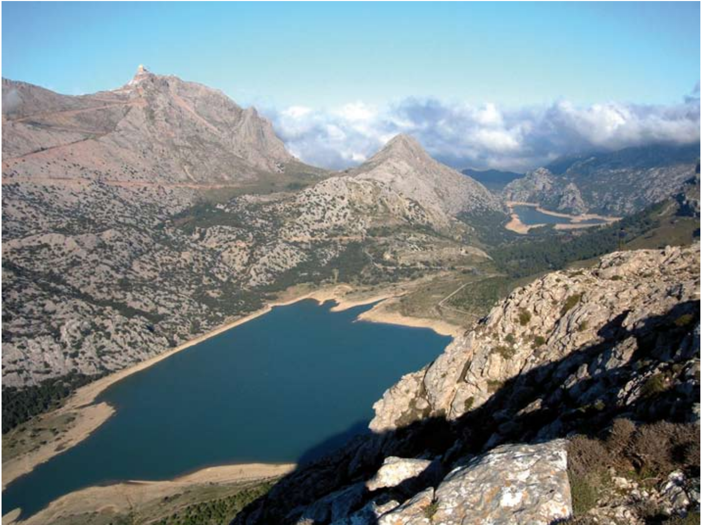
Embassament de Cúber i del gorg Blau

Cúber, fins a principi del segle XX, fou una possessió dedicada sobretot a l'agricultura i la ramaderia ovina extensiva. Els aprofitaments agrícoles es feien al fons de la vall, on es trobaven les millors terres per a les pastures i el conreu de cereals. La inundació de la vall de Cúber l'any 1972 suposà la destrucció de les cases de possessió, dels horts i dels sementers i, per tant, la desaparició de les activitats agrícoles.