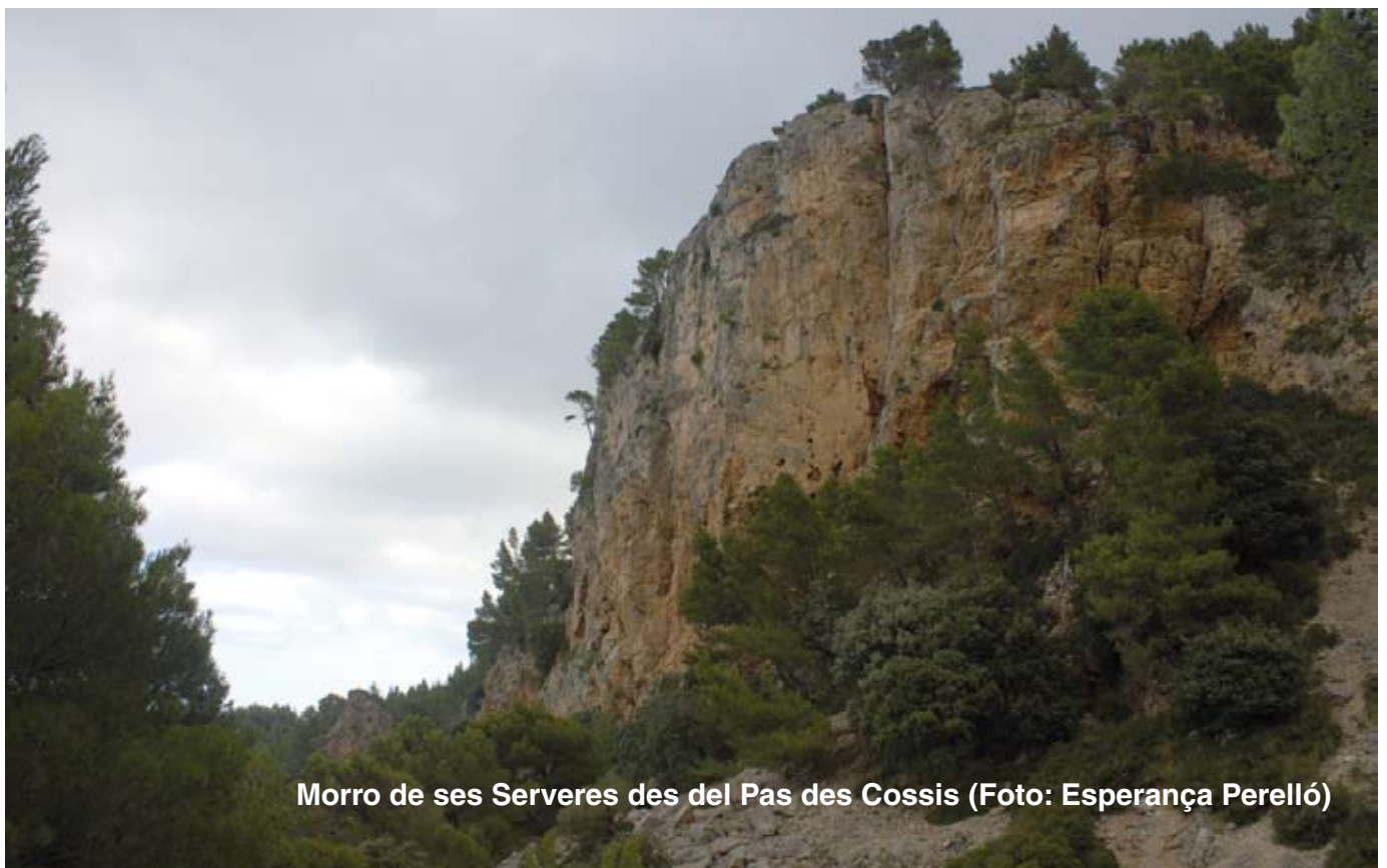
Morro de ses Serveres des del Pas des Cossis

Malgrat tot, no va aconseguir escapar de Mallorca, ja que quan va arribar a Palma va ser empresonat al castell de Bellver.