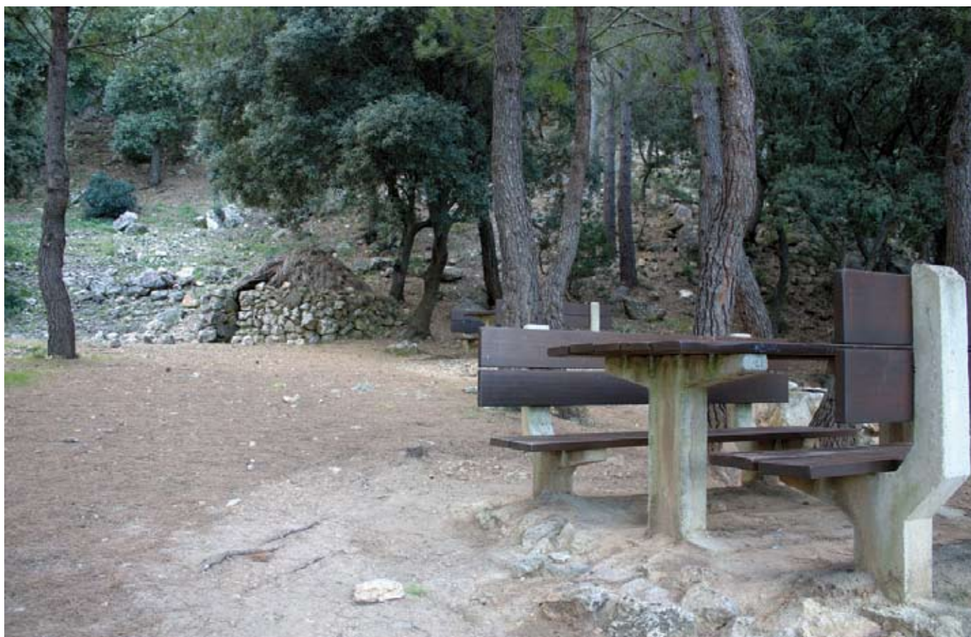
Àrea recreativa de Son Fortuny

Baixam del puig de Galatzó i tornam pel mateix camí fins al pas de na Sabatera. D'aquí, girarem a mà esquerra en direcció al pas des Cossis, que ens durà en uns 55 min de tornada a l'àrea recreativa de Son Fortuny.