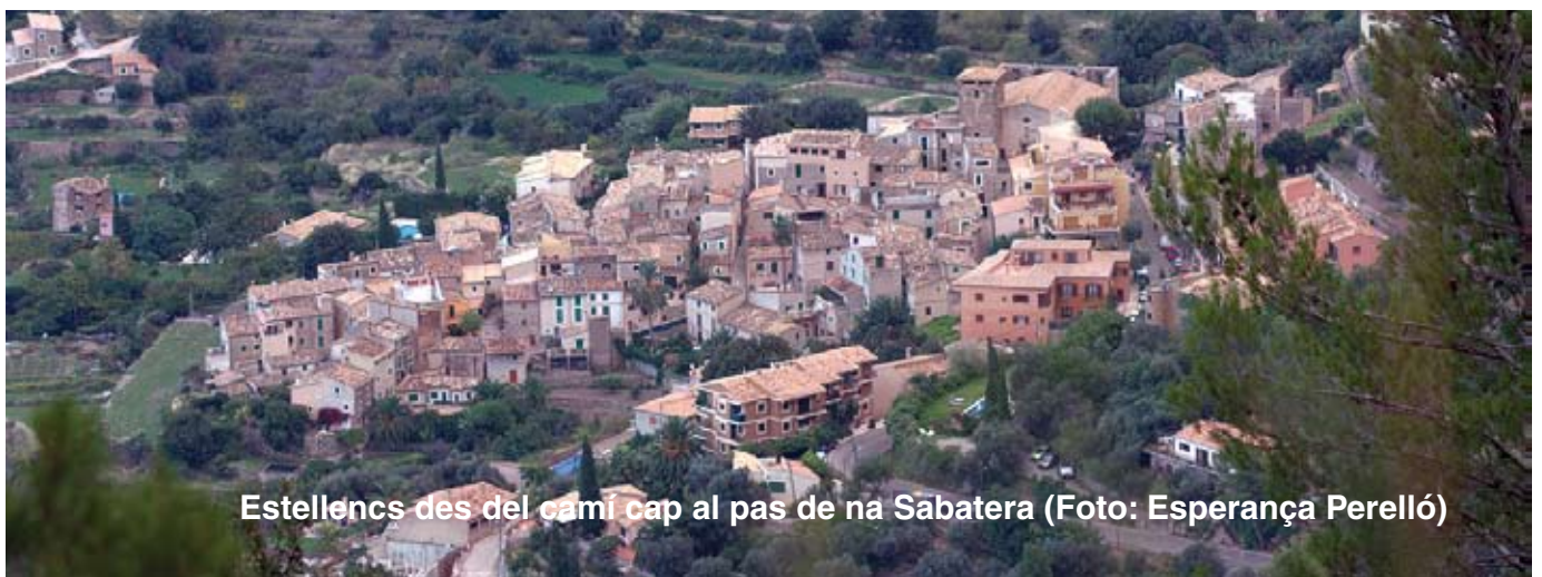
Estellencs des del camí cap al pas de na Sabatera