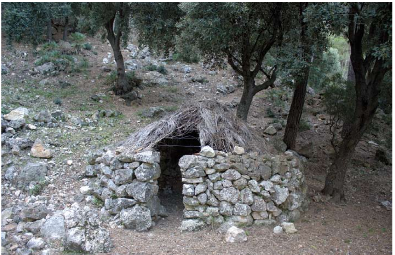
Barraca de carboner al Boal de ses Serveres

“Caminos y paisajes”. Gaspar Valero i Martí