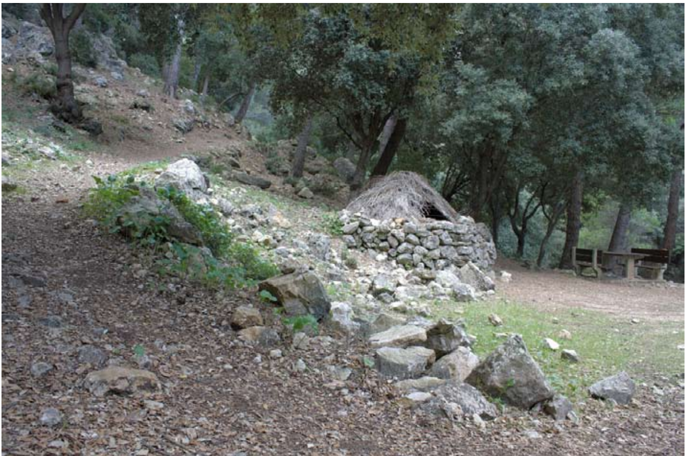
Inici del camí cap al pas des Cossis

Després d'una pujada lleu, a pocs metres a mà esquerra tenim el mirador de la Boal de ses Serveres. El camí a partir d'ara es troba una mica envaït pel càrritx ( Ampelodesmos mauritanica ) i al cap d'uns metres es converteix en un tirany de muntanya que transcorre arrapat a la penya. No ens serà gens difícil seguir les fites entre el càrritx, sols ens cal anar amb compte de no llenegar amb les fulles!