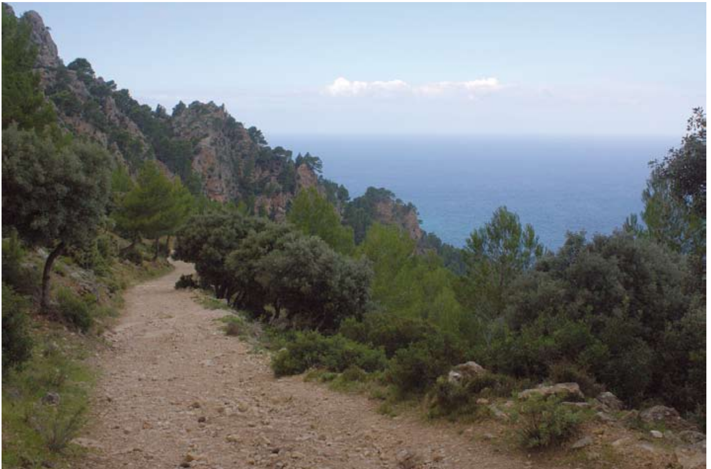
Vista des del camí a la Boal de ses Serveres

Al cap d'uns 20 minuts d'ascens, arribam a un replà on hi ha un dipòsit d'aigua per a la lluita contra els incendis forestals. El camí que deixam a la dreta arriba al refugi de la coma d'en Vidal. Nosaltres prenem el de l'esquerra, que ens durà a la Boal de ses Serveres.