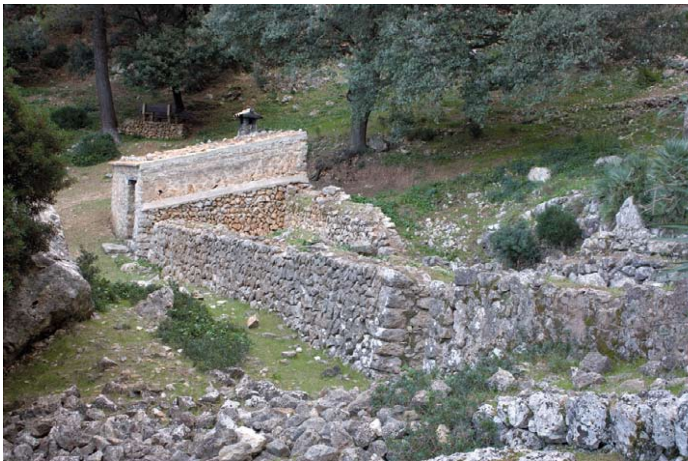
Refugi de la Boal de ses Serveres

Als 15 min arribam a un rotlo de sitja que es troba gairebé penjat al buit. És un bon lloc per pensar en com vivien els homes i dones que treballaven als boscos de Tramuntana. Gaudirem també d'una bona panoràmica del municipi d'Estellencs.