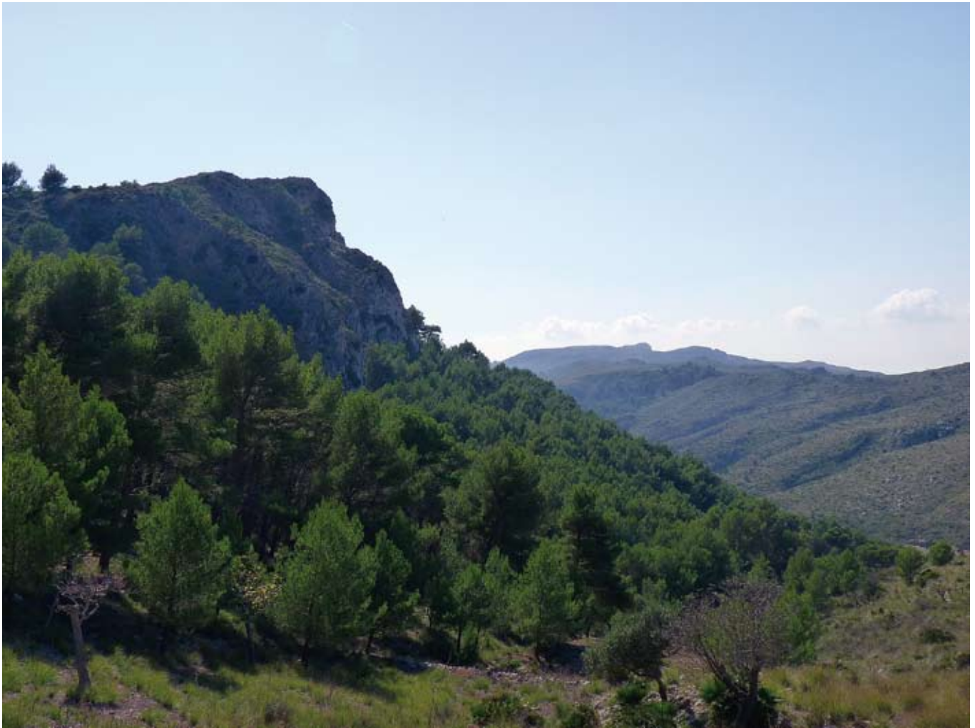
Puig des Corb

Travessam el Campament i iniciam la caminada pel tirany que s'allunya d'aquí en direcció sud-est. Passat el tancat que envolta el conjunt de runes, hi trobam un aljub i unes piques, que també emprava la colònia penitenciària. Poc després veim una darrera caseta i el traçat senyalitzat ens condueix a l'esquerra, deixant a la nostra esquena el puig des Corb.