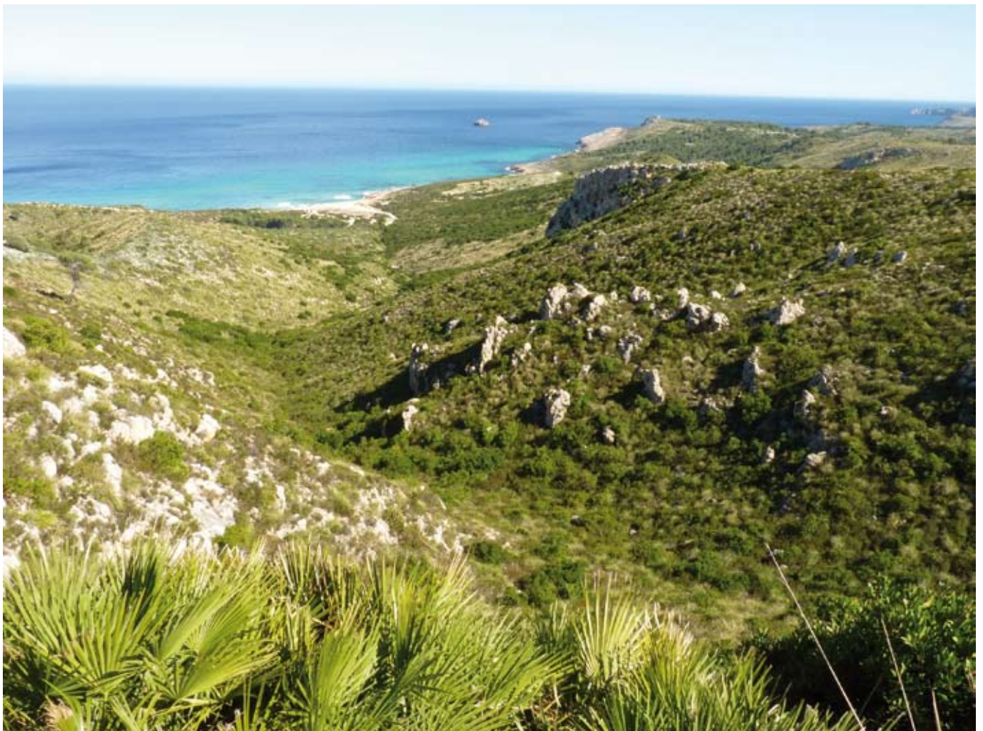
El torrent des Porrassar

Els diferents trams dels torrents adopten noms distints segons els indrets pels quals transcorren. Aquí veim ramificacions del torrent des Porrassar, que, quan s'ajunta més avall amb el de s'Arboçaret, formen el torrent des Castellot, que desemboca a la cala de la Font Celada.