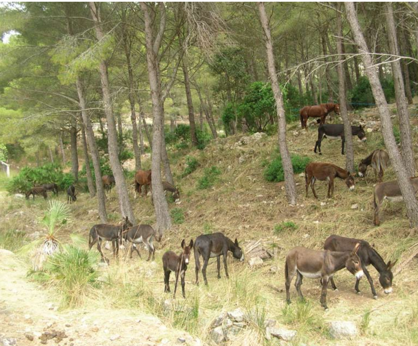
Pastura controlada en una faixa o tallafoc

densitat de vegetació als costats dels camins mitjançant el pasturatge d'ases, someres i vaques.