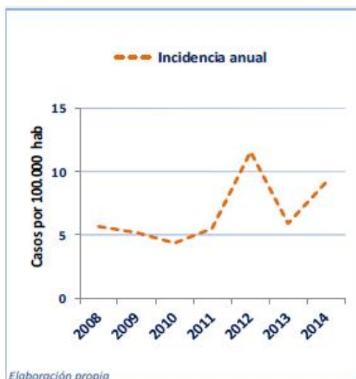
Figura 1.- Tendencia de la incidencia de casos confirmados por Tos ferina notificados por los países de UE/EEA, 2008-2014

Entre las posibles causas que se señalan están: la mejora en el acceso a técnicas de diagnóstico rápido que permiten una mejor notificación de la enfermedad, la evanescencia del efecto protector de la vacuna y la menor efectividad de la vacuna acelular comparada con la efectividad de la vacuna de células enteras.