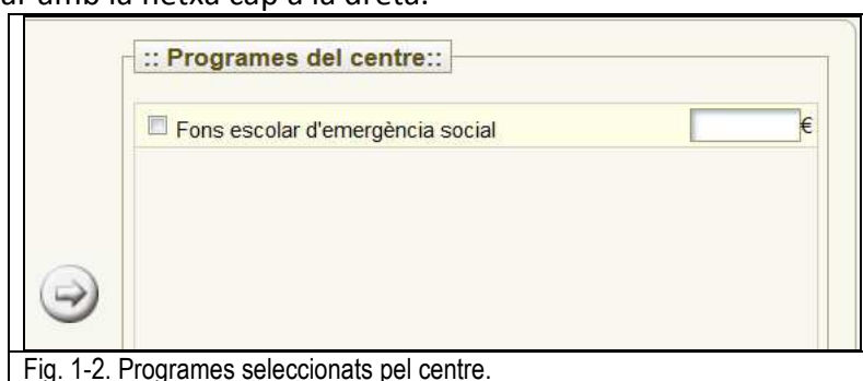
Fig. 1-2. Programes seleccionats pel centre.

Si voleu fer servir aquesta funcionalitat, heu de triar, i 'fer vostre' el programa que heu de menester. A Manteniment/Programes centre , he de seleccionar el programa que vulgueu, i tirar amb la fletxa cap a la dreta.