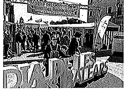
Ibiza, la isla más «balear» y Menorca, la que menos