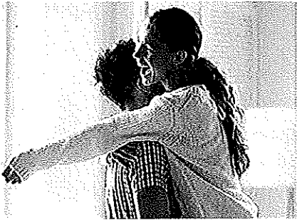
Estrena piso con hasta un 35% de descuento www.servihabitats.com