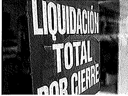
Crece al 5% la morosidad de las operaciones avaladas por el ISBA