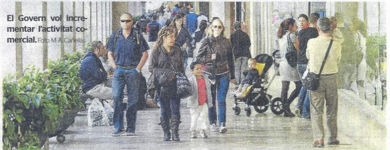
El Govern vol incrementar l'activitat comercial.

Aprova un pla amb deu canvis legislatius, la majoria prevists, i anuncis fets. La novetat són les "licències exprés", per obrir negocis en 24 hores. També s'ampliaran horaris comercials