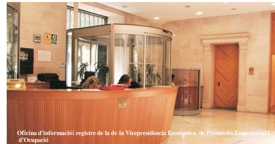
Oficina d'informació i registre de la de la Vicepresidència Econòmica, de Promoció Empresarial i d'Ocupació