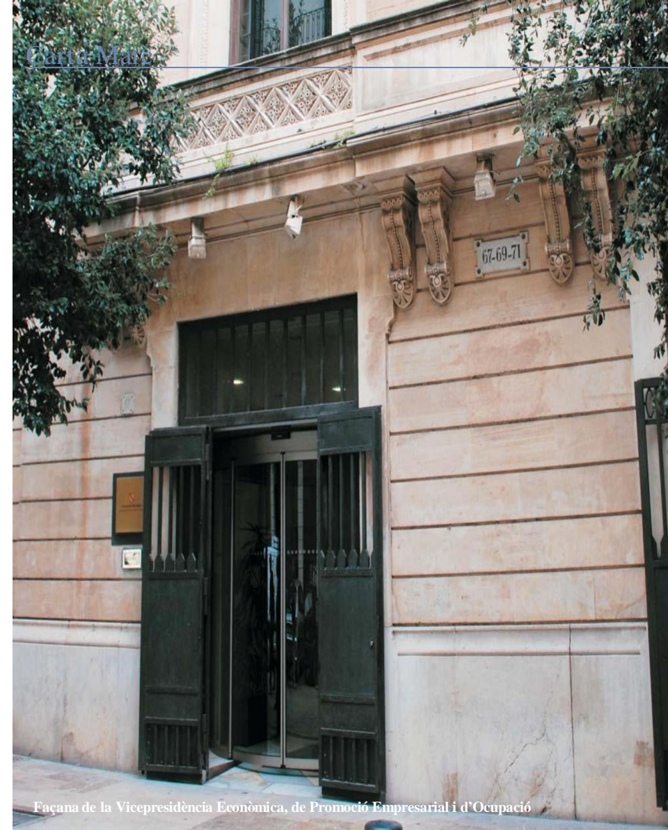
Façana de la Vicepresidència Econòmica, de Promoció Empresarial i d'Ocupació