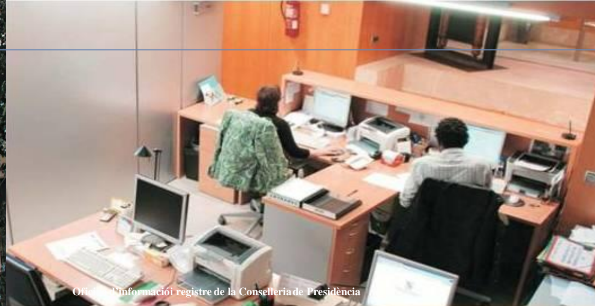
Oficina d'informació i registre de la Conselleria de Presidència