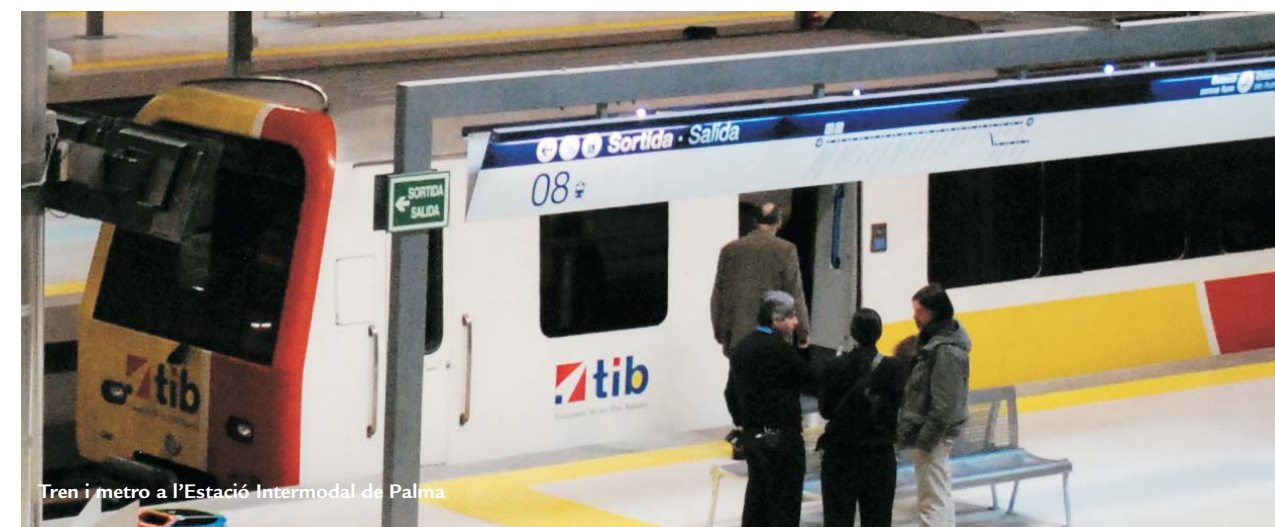
Tren i metro a l'Estació Intermodal de Palma