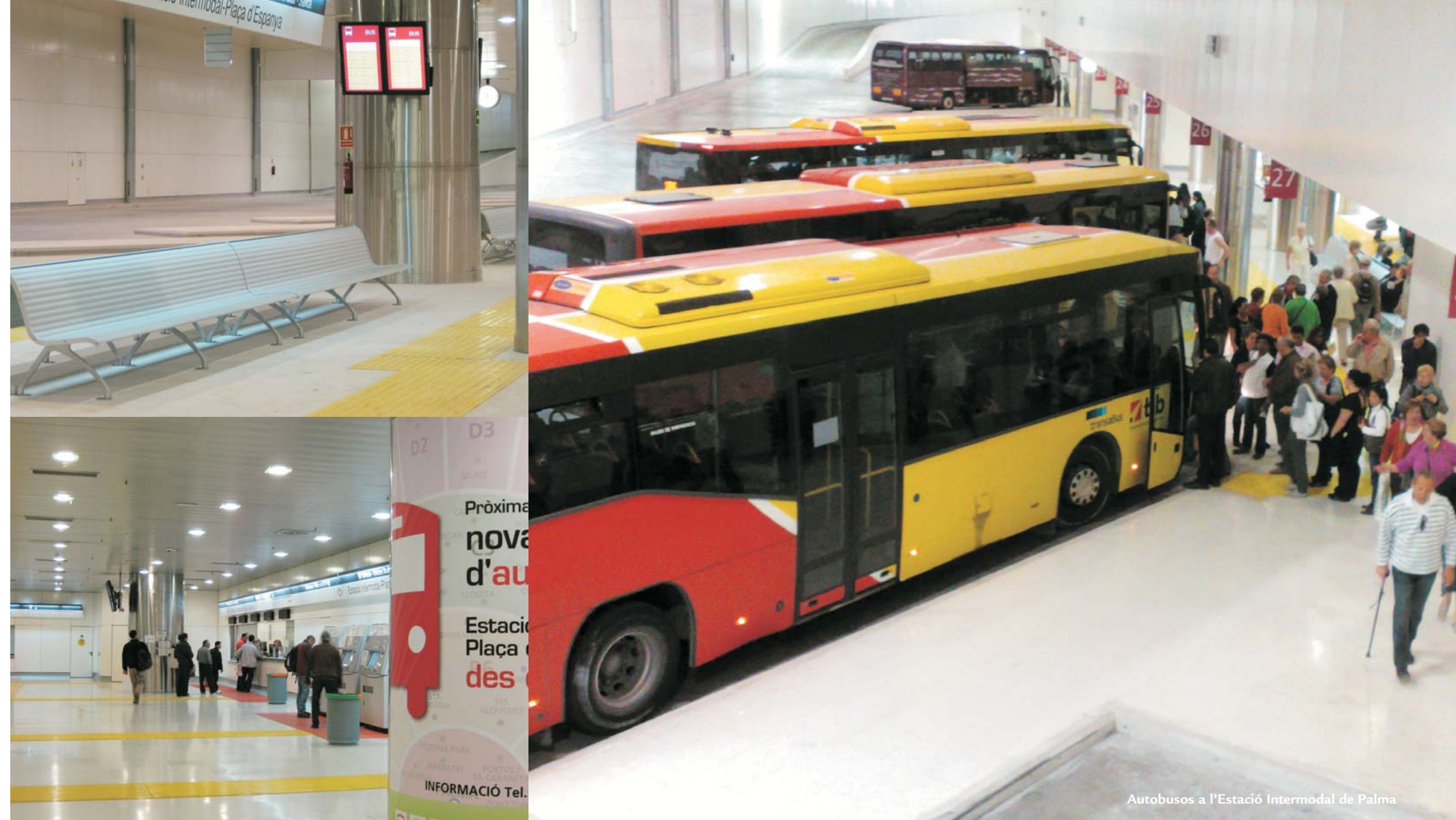
Autobusos a l'Estació Intermodal de Palma