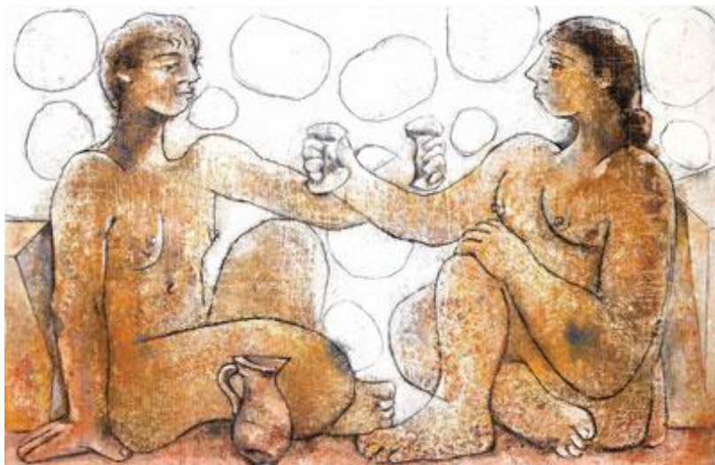
Imatge: Joan Bennàssar

la vinya) i la viticultura (elaboració del vi) que els havien deixat els egipcis i ho convertiren en una nova ciència. Evidentment, havien de demostrar que eren la civilització més avançada del moment i el bressol d'Occident, també en matèria vitivinícola. «Els pobles mediterranis començaren a emergir de la barbàrie quan aprengueren a conrar l'olivera i el cep», declarà l'historiador grec Tucídides al segle V aC.