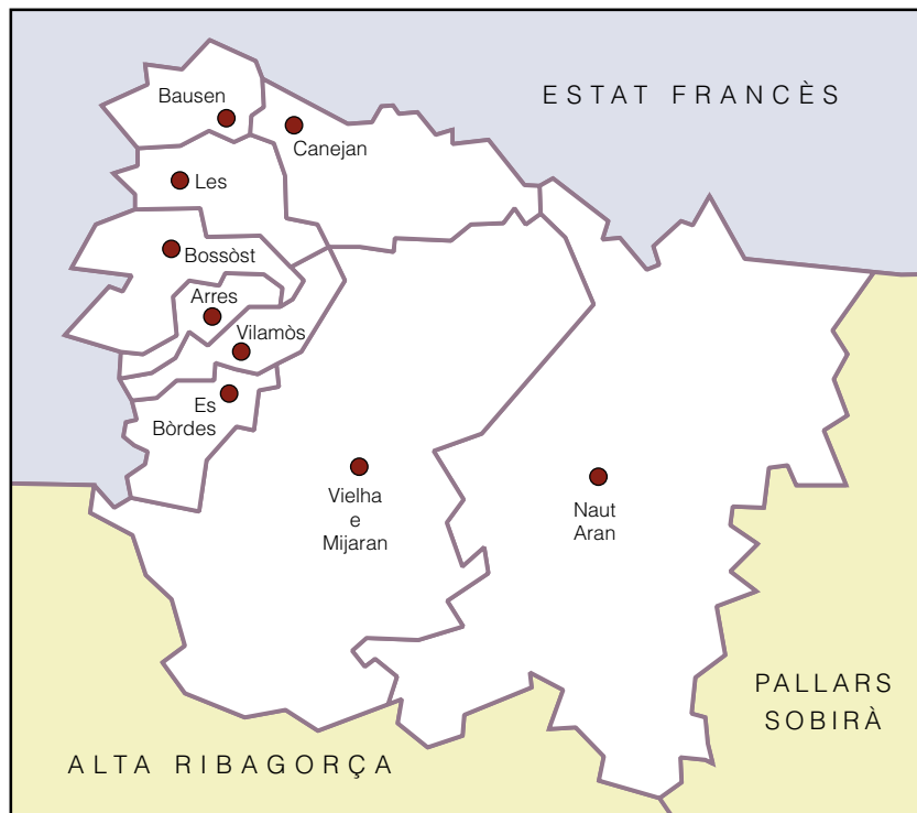
Mapa administratiu de la Vall d'Aran

comprensió i la parla són més elevades al Baish Aran i el Naut Aran, mentre que la capacitat d'escriptura és relativament superior a la zona de Mijaran. L'edat, el lloc de naixença i el nivell d'instrucció són variables a tenir en compte per entendre aquesta distribució.