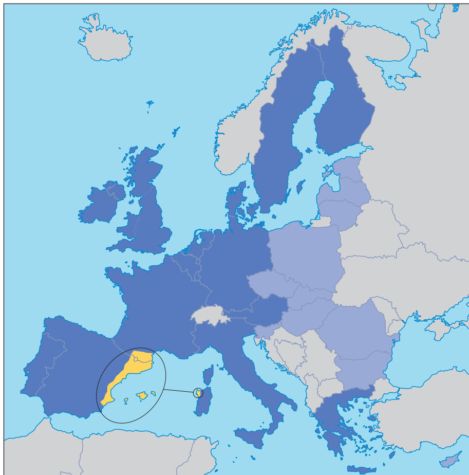
Europa i els Països Catalans

El domini lingüístic de la llengua catalana s'estén sobre 68.000 km 2 en els quals viuen 11.380.000 persones. Actualment està dividit en set territoris distribuïts en quatre estats: Andorra, Espanya, on està situada la major part de la població i superfície, França i Itàlia.