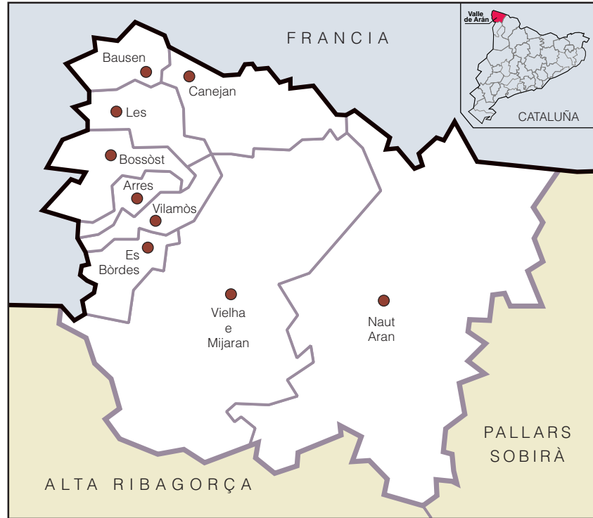
Mapa administrativo del Valle de Arán

la comprensión y el habla son más elevadas en Canejan, Bausen, Les, Bossòst y el Naut Aran, mientras que la capacidad de escritura es relativamente superior en la zona de Mijaran. La edad, el lugar de nacimiento y el nivel de instrucción son variables a tener en cuenta para entender esta distribución.