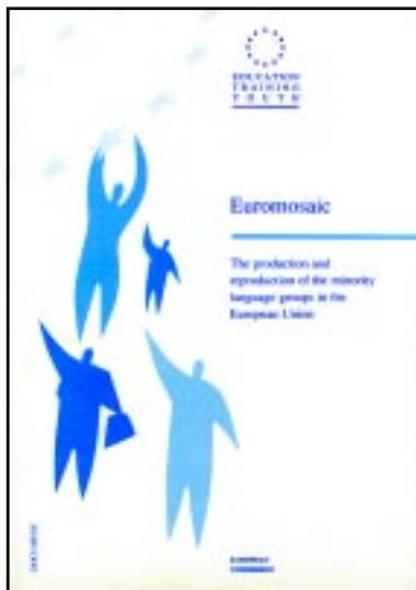
Caperader der estudi Euromosaic, que tracte sus es diüersi grops lingüistics minorizadi des estats membres dera UE

Eth catalan a quauqu'ues des caracteristiques des nomentades lengües minoritàries, com era lèu lèu inexistència de persones monolingües e, per tant, poblacion bilingüizada, era apertenéncia des territòris deth sòn encastre lingüistic en estats mès grani a on era lengua dera majoria ei ua auta, o era manca de preséncia en quauqui sectors dera vida social.